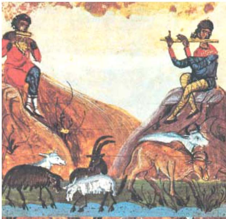
4. Κτηνοτρόφοι βόσκουν το κοπάδι τους (βυζαντινή μικρογραφία)

Λέων Γ' (απόσπασμα από την εισαγωγή της Εκλογής ).