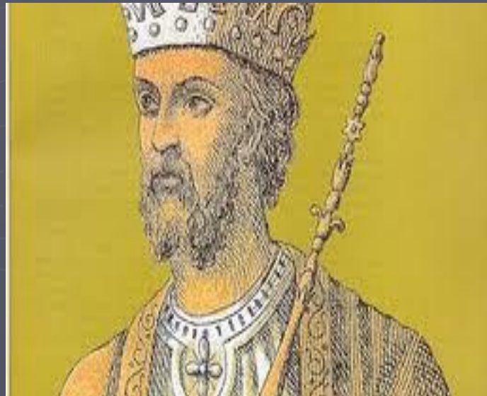
Λέων ο Γ' ο Ίσαυρος

Έτσι ο Ευτύχιος κατάλαβε τους λόγους για τους οποίους ο Λέων και ο γιος του Κωνσταντίνος θέλησαν να επιβάλουν μια θρησκευτική μεταρρύθμιση θέτοντας υπό διωγμό τους μοναχούς, απαγορεύοντας τις άγιες εικόνες. Και δυστυχώς, την κακοδοξία τους υιοθέτησε ο αυτοκράτορας Λέοντας Αρμένης.