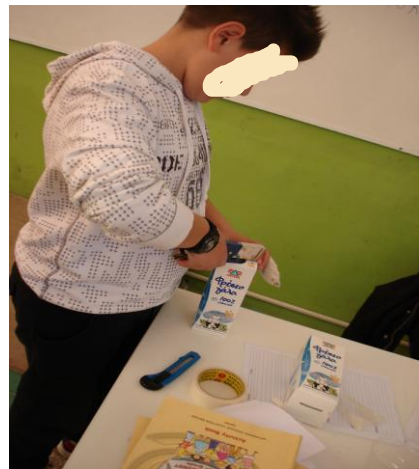
Δουλεύοντας με προσοχή...