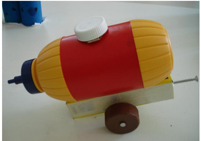
...έγιναν ένα βυτίο ραντίσματος