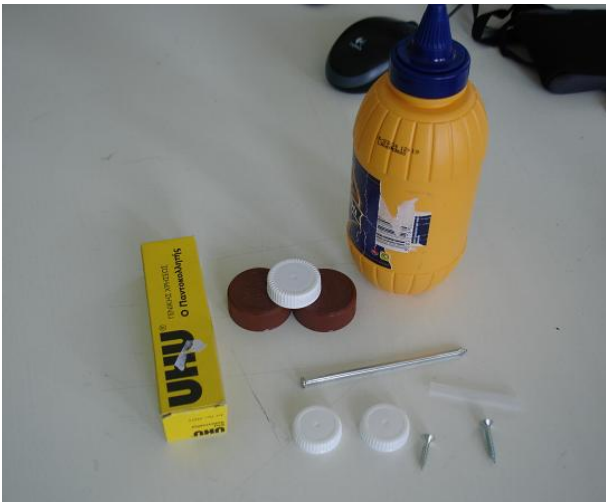
Ένα άδειο μπουκάλι από μουστάρδα, ένα άδειο κουτί από κόλλα, καρφί, βίδες και καπάκια από γάλατα...