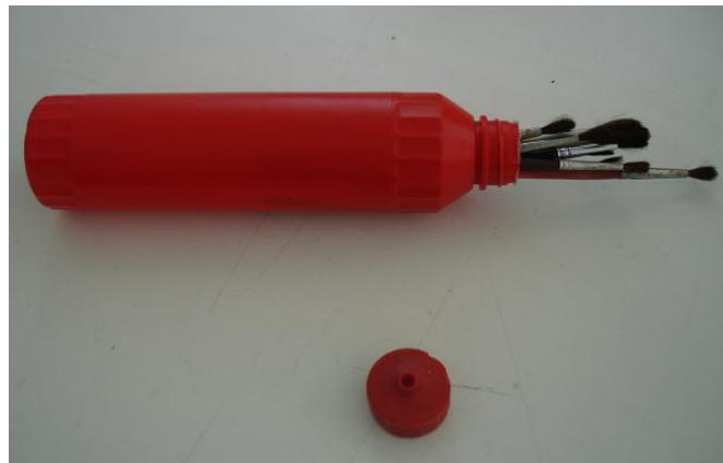
Ένα άδειο μπουκάλι από κέτσαπ έγινε θήκη για τα πινέλα μας