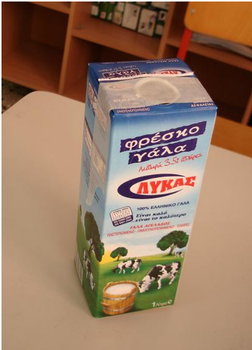
Μία από τις συσκευασίες που χρησιμοποιήθηκαν, λίγο πριν κολληθεί