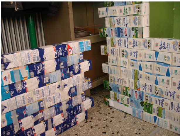
Οι τοίχοι. Τα κομμάτια που προεξέχουν θα βοηθήσουν στη στερέωση αναμεταξύ τους.