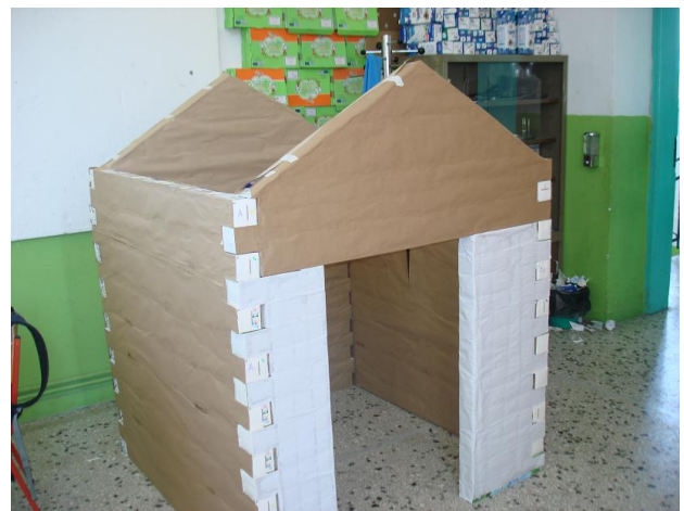
Το σπιτάκι μας ετοιμάζεται.