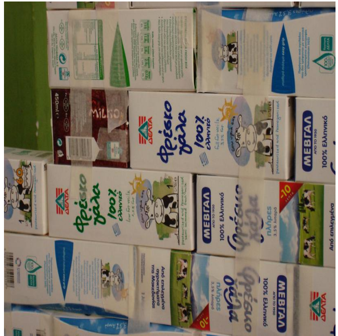
Το «χτίσιμο» του τοίχου. Η χαρτοταινία βοηθούσε στην σταθεροποίηση ωστότου να στεγνώσει η κόλλα