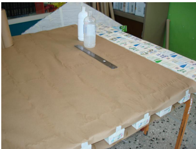
Οι τοίχοι ντύνονται με χαρτί του μέτρου