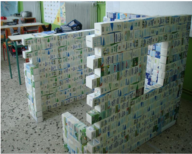
Προχωρώντας την κατασκευή