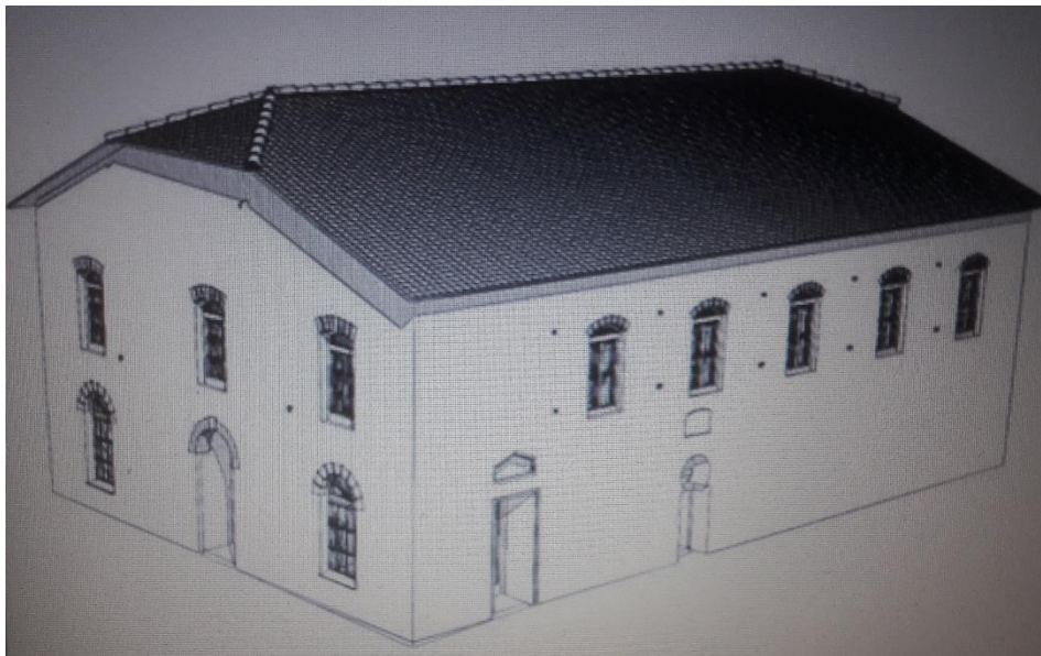
Ο Ι.Ν.Αγίων Αποστόλων του Τσουρχλίου Γρεβενών που χτίστηκε το 1836

Θέτουν τα όπλα εις την γη ολίγα παλλικάρια και σκάπτουν περίλυπα,κι αδειάζουνε το χώμα με πονεμένη την καρδιά...θλιφτή σαν τα πρινάρια iii τα μαυρισμέν' απ' την φωτιά,όπου καπνίζ' ακόμα. Και στη γραμμή αφήνουνε τρεις τάφους ανοιγμένους δια να σφικτοκλείσουνε τους τρεις ανδρειωμένους.