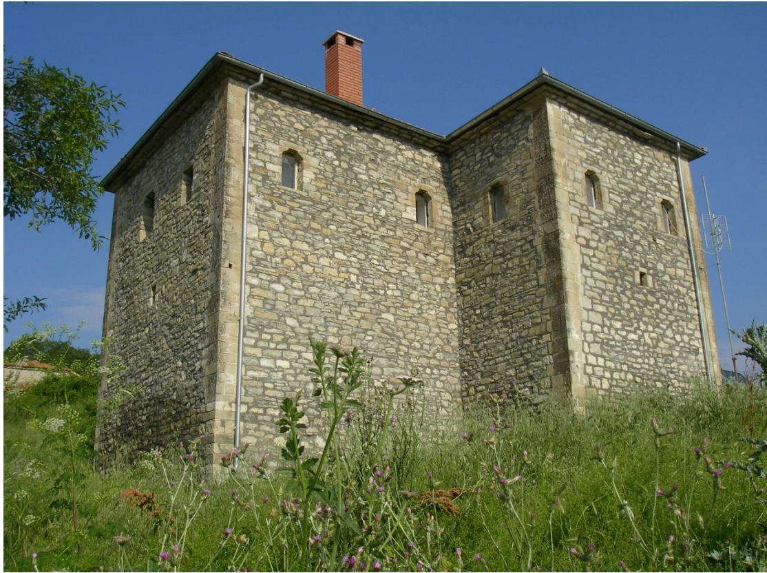
Η κούλια της Λόχμης Γρεβενών του 1848

Τους μπέηδες τσιφλικάδες των Γρεβενών δεν τους ενδιέφερε αν οι κολλήγοι εργάτες ήταν χριστιανοί ή μουσουλμάνοι παρά μόνο αν ανεμπόδιστα μπορούσαν να προσπορίζονται οφέλη από την εκμετάλλευση των τσιφλικιών τους.