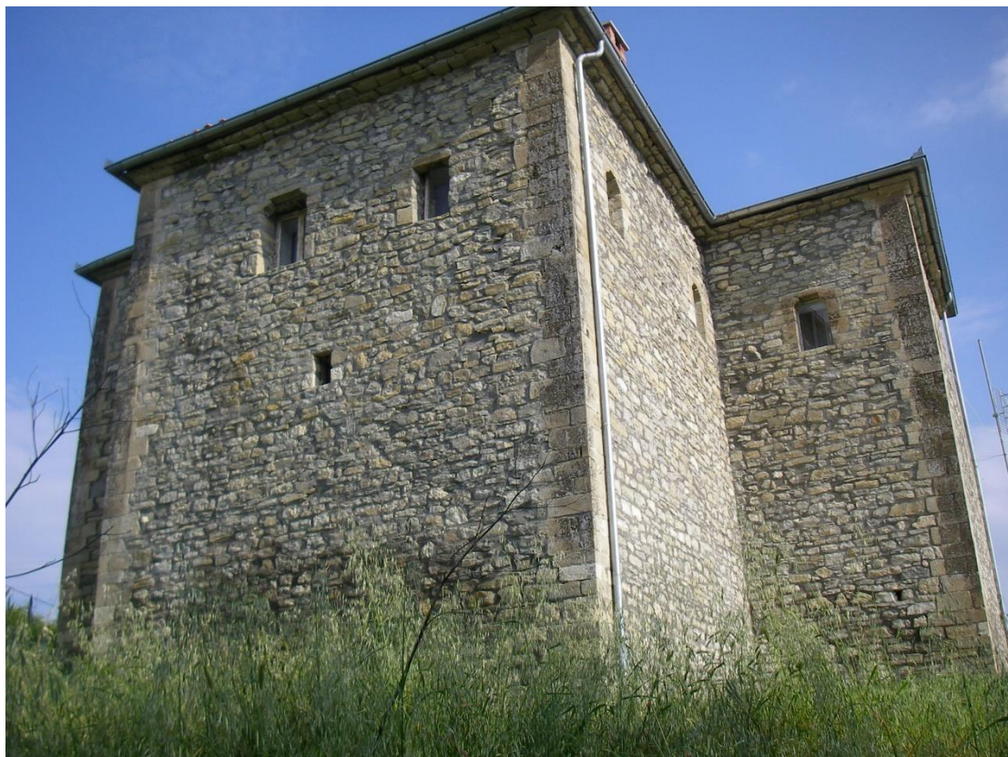
Η κούλια του Γιμάζ Ζαγάγ του 1848 στη Λόχη Γρεβενών

Μέχρι και την περίοδο του Σουλεϊμάν του Μεγαλοπρεπή το 1564/1565 η περιοχή αποτελούνταν από αμιγή χριστιανικό πληθυσμό. Από το χρονικό αυτό σημείο και μετά ξεκινούν οι εκουσίες ή παρά τη θέληση των κατοίκων αλλαξοπιστίες.