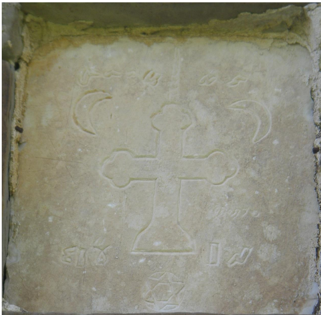
Αναθηματική πλάκα με το σταυρό την ημισέληνο και την πεντάλφα στον ΙΝ Ταξιαρχών Λόχμης Γρεβενών

εκκλησίες που οι ίδιοι οι τσιφλικάδες έκτιζαν δίπλα στις κούλιες. Χαρακτηριστικό παράδειγμα αποτελεί η μοναδική σωζόμενη κούλια στη Δυτική Μακεδονία η κούλια της Λόχμης ,που παλιότερα λεγόταν Βίτσι, στο βόρειο τμήμα της Π.Ε. Γρεβενών που σήμερα υπάγεται στο Δημοτικό διαμέρισμα Αμυγδαλιάς Γρεβενών. Η εκκλησία των Παμμέγιστων Ταξιαρχών της Λόχμης Γρεβενών χτίστηκε την ίδια χρονιά που χτίστηκε η κούλια του Ιλιάζ Ζαγάγ, γεγονός που αποδεικνύει ότι ο Αλβανός μπέης συμφώνησε στο χτίσιμο της διπλανής στην κούλια εκκλησίας.