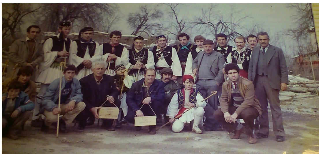
Ρουγκατσάρια στον Άγιο Γεώργιο το 1984

Απ' τς αρχοντάδες φεύγουμε στους αφεντάδες πάμε.