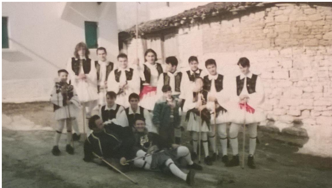
Ρουγκατσάρια στον Αγιώργη το 1990

Εδώ έχουν κόρη για παντρεία κόρη' ραβωνιασμένη την τάζουν γιο του Βασιλιά,την τάζουν γιο του Ρήγα -Δεν θέλω εγώ γιο Βασιλιά,δεν θέλω γιο του Ρήγα μον' θέλω τ' αρχοντόπουλο τ' άξιο το παλληκάρι που κοσκινίζει τα φλουριά και δερμονίζει τα γρόσια ή (που παίζει τη φλογέρα) ή (που μέσα από την πολη).