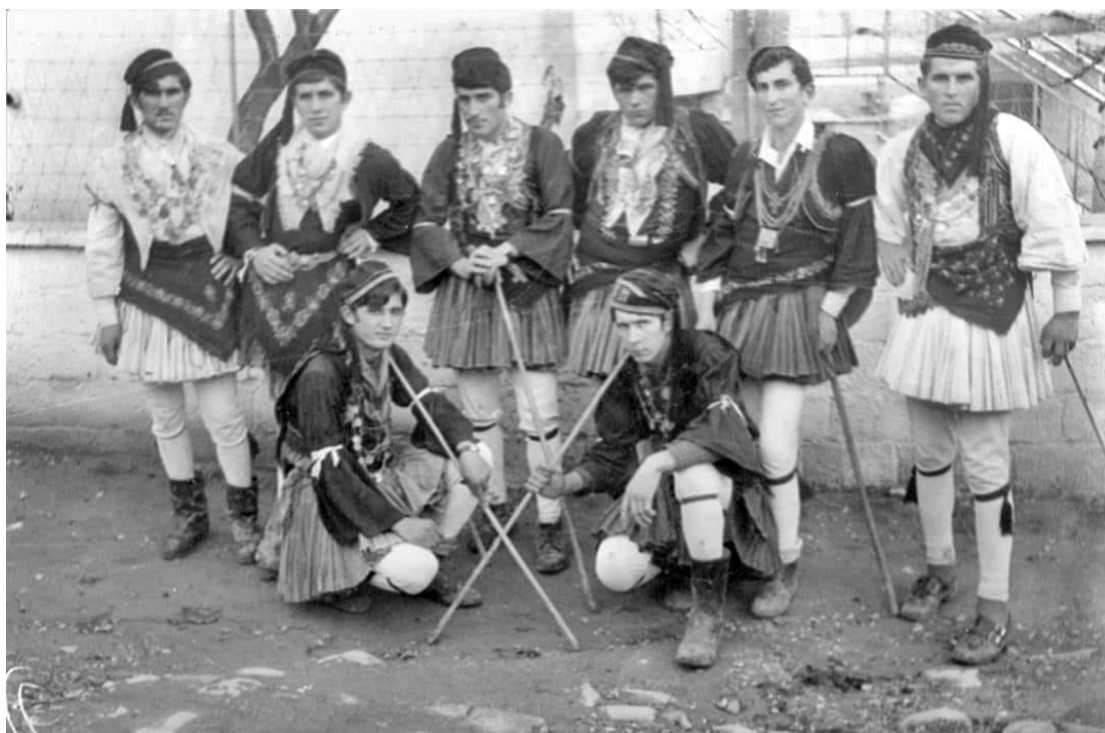
Ρουγκατσάρια 1972 στον Άγιο Γεώργιο Γρεβενών

Η Δυτική Μακεδονία πάντοτε είχε πολλούς ξενητεμένους σε όλα τα μήκη και τα πλάτη της γης ,επομένως δε θα μπορούσε να λείπει τραγούδι για τα σπίτια που είχαν ξενητεμένο που τον πρόσμεναν να γυρίσει για να τον δουν.