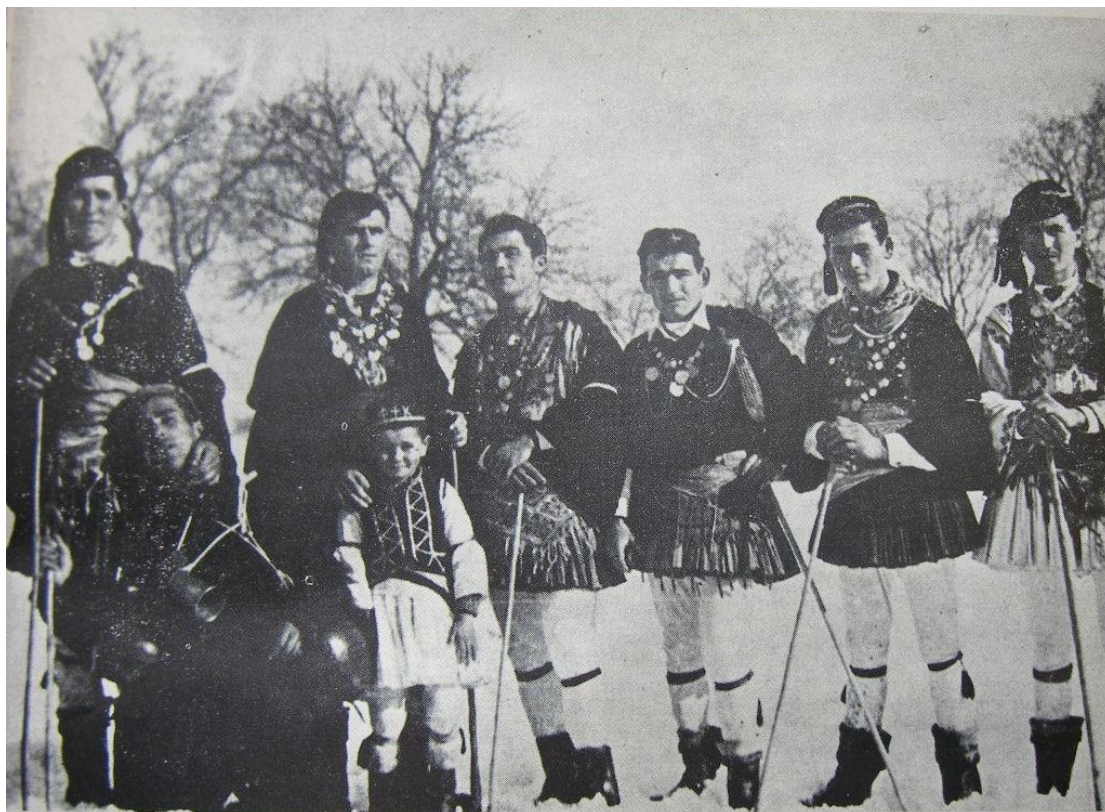
Ρογκατσάρια στον χιονισμένο Άγιο Γεώργιο Γρεβενών το 1960 με τις γκλίτσες στο χέρι και τον κουδουνά ζωσμένο.

Συνεπώς η ύπαρξη του εθίμου των ρογκατσαριών στη Κοζάνη πρέπει να τοποθετηθεί πολύ παλιά, γύρω στα 1650 όπου γίνεται η πρώτη βιοτεχνική και εμπορική ανάπτυξη