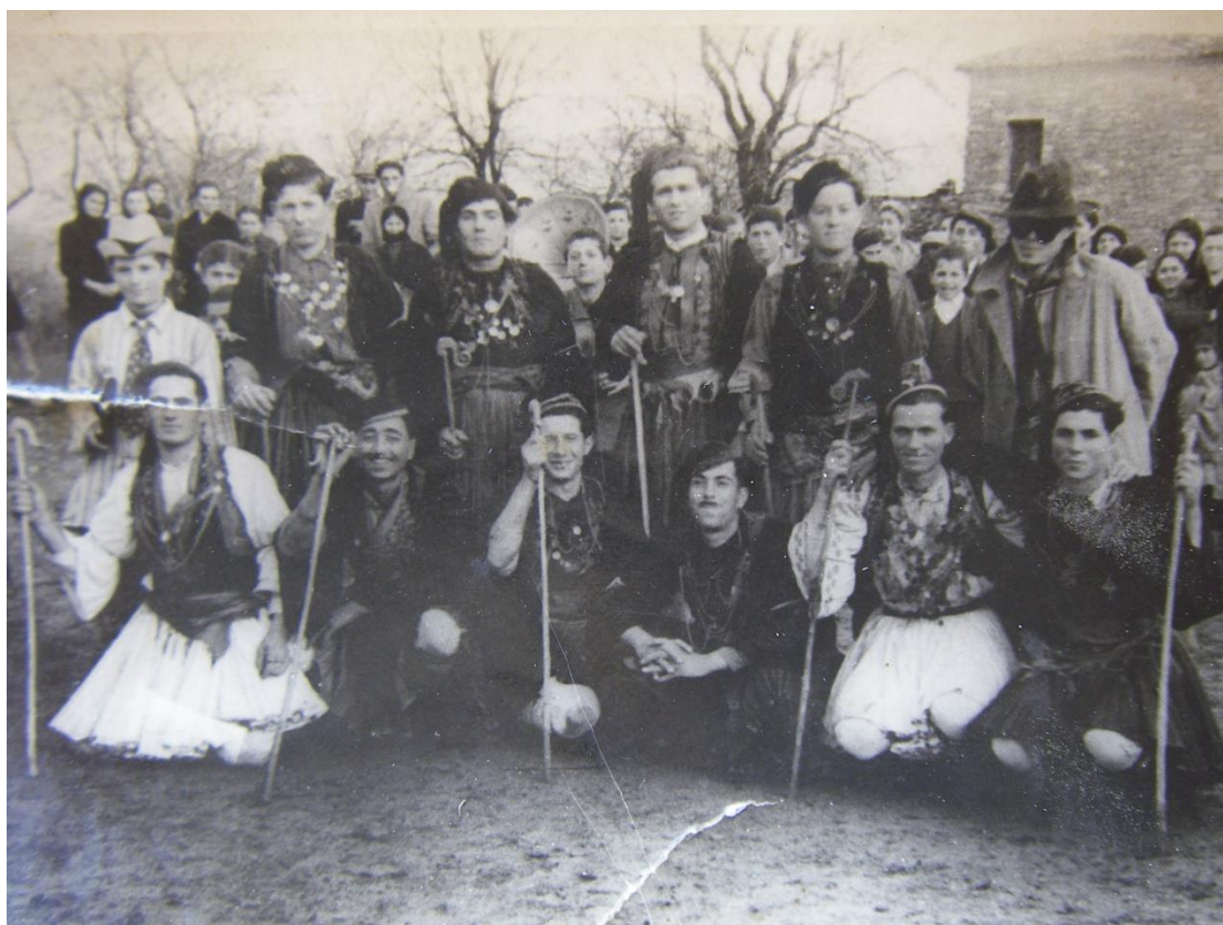
Ρουγκατσάρια με τις λέραβες φουστανέλες στον Άγιο Γεώργιο Γρεβενών το 1950. Πίσω διακρίνεται κι ένα γραμμόφωνο

Τα Ρουγκατσάρια είναι έθιμο του Δωδεκαήμερου δηλαδή του διαστήματος μεταξύ της Γέννησης του Χριστού και της παραμονής των Φώτων. Έχει τις ρίζες του στα έθιμα όπου κυριαρχεί η μεταμφίεση και έχει τραγούδια σε δεκαπεντασύλλαβους στίχους. Τα άσματα αυτά αποσκοπούν με τα επαινετικά τους λόγια να δειλάσουν τους νοικοκύρηδες και τις νοικοκυρές να κεράσουν τα παλληκάρια που τα τραγουδούν.