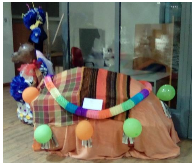
5ο ΓΥΜΝΑΣΙΟ ΠΑΤΡΩΝ