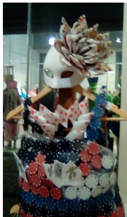
ΕΠΑΛ Κ. ΑΧΑΪΑΣ