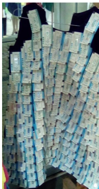
7ο ΕΠΑΛ ΠΑΤΡΩΝ