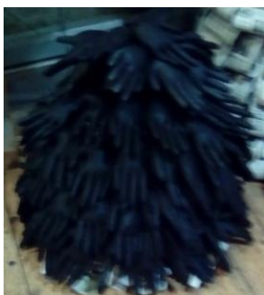
ΕΠΑΛ Κ. ΑΧΑΪΑΣ