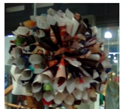
ΕΠΑΛ Κ. ΑΧΑΪΑΣ