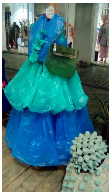
7ο ΕΠΑΛ ΠΑΤΡΩΝ