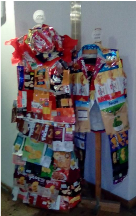
7ο ΕΠΑΛ ΠΑΤΡΩΝ