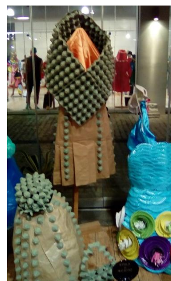
ΕΠΑΛ Κ. ΑΧΑΪΑΣ