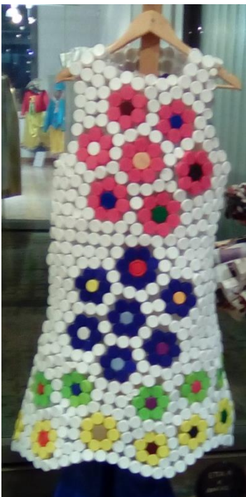
ΕΠΑΛ Κ. ΑΧΑΪΑΣ