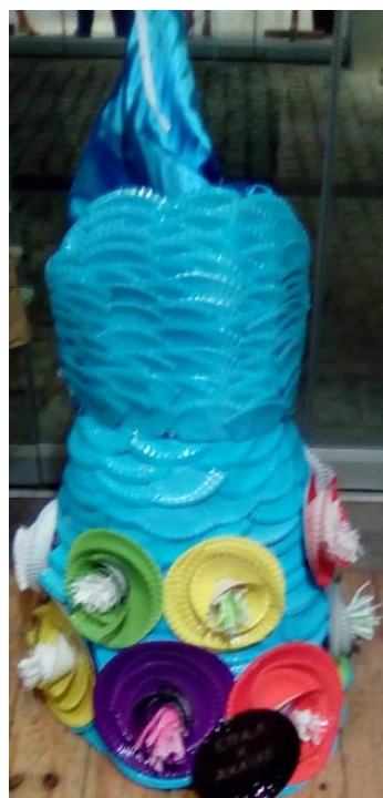
ΕΠΑΛ Κ. ΑΧΑΪΑΣ