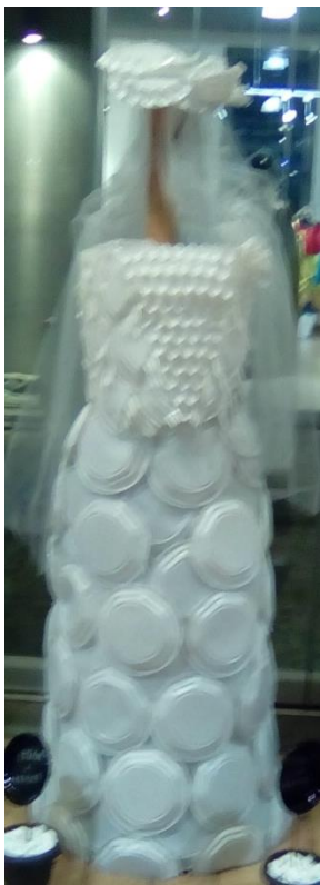
ΕΠΑΛ Κ. ΑΧΑΪΑΣ