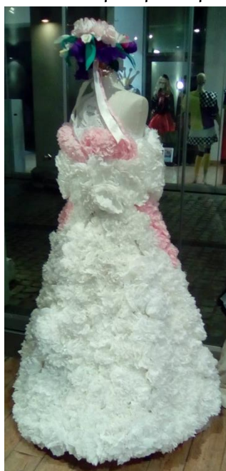
7ο ΕΠΑΛ ΠΑΤΡΩΝ