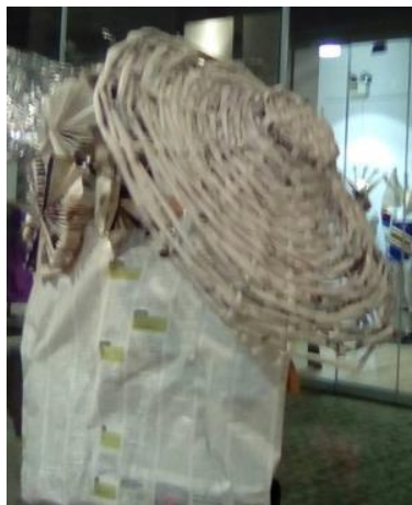
7ο ΕΠΑΛ ΠΑΤΡΩΝ