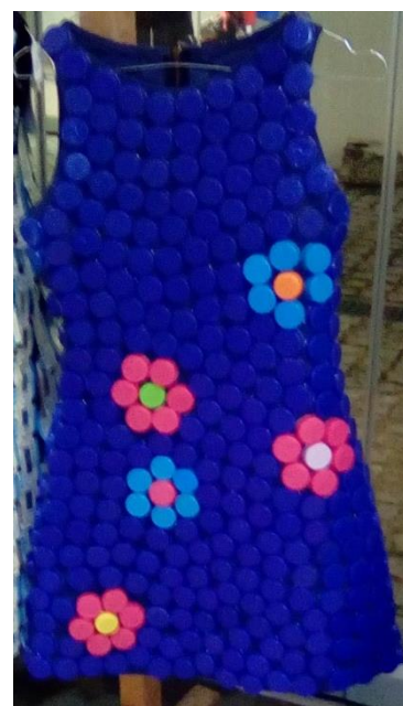
7ο ΕΠΑΛ ΠΑΤΡΩΝ