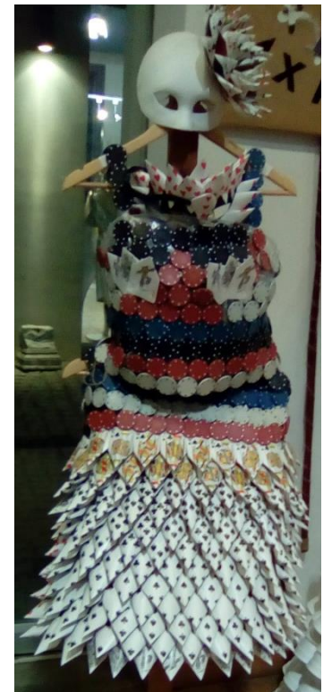
ΕΠΑΛ Κ. ΑΧΑΪΑΣ