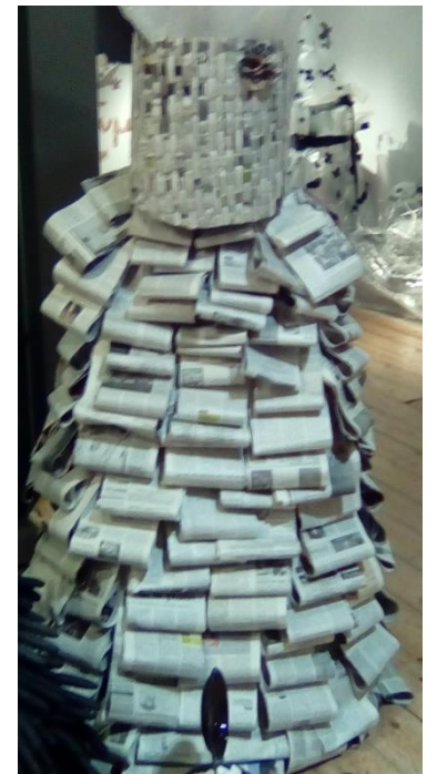
ΕΠΑΛ Κ. ΑΧΑΪΑΣ