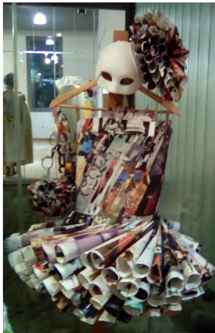
ΕΠΑΛ Κ. ΑΧΑΪΑΣ