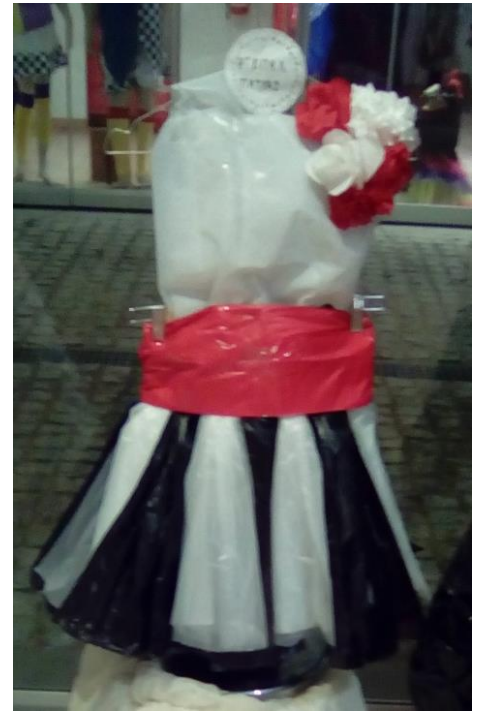
7ο ΕΠΑΛ ΠΑΤΡΩΝ