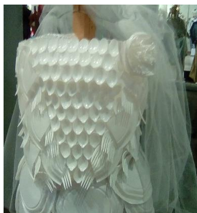
ΕΠΑΛ Κ. ΑΧΑΪΑΣ