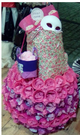
7ο ΕΠΑΛ ΠΑΤΡΩΝ