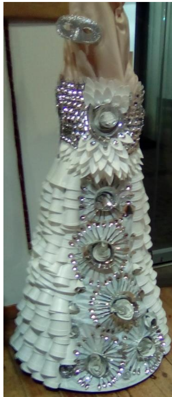
ΕΠΑΛ Κ. ΑΧΑΪΑΣ