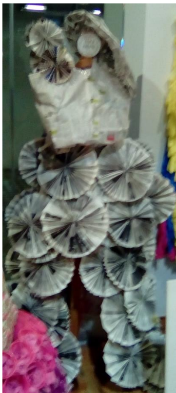
7ο ΕΠΑΛ ΠΑΤΡΩΝ