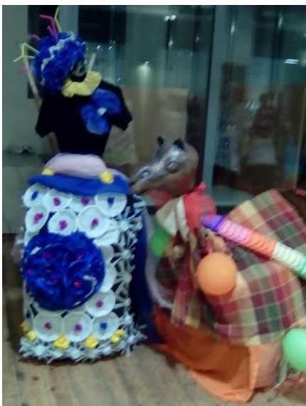
5ο ΓΥΜΝΑΣΙΟ ΠΑΤΡΩΝ