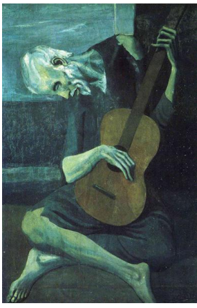
6. The Old Guitarist, 1903