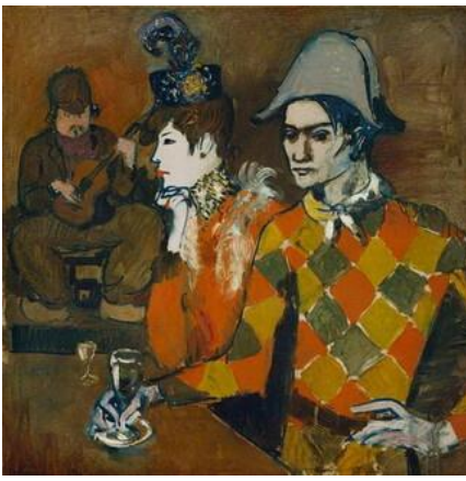
11. Au Lapin Agile (1904)