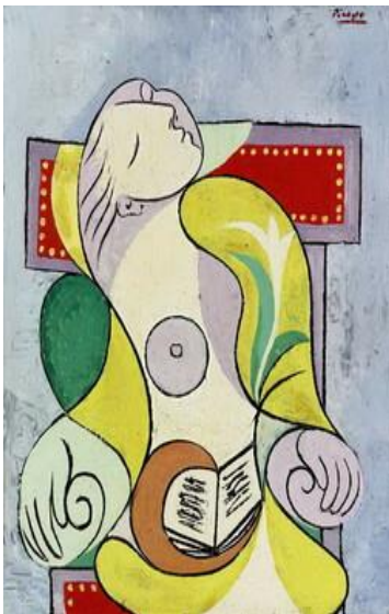
13. La Lecture (1932)