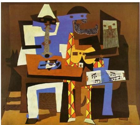
5. Ο αρλεκίνος