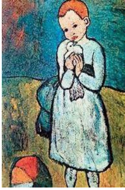
2. "Το παιδί και το περιστέρι"