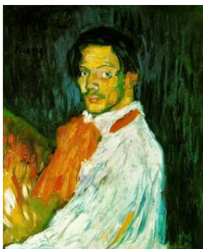
10. Αυτοπροσωπογραφία Πικάσο, 1901