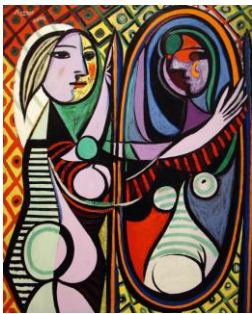
4. Το κορίτσι μπροστά στον καθρέπτη, 1932