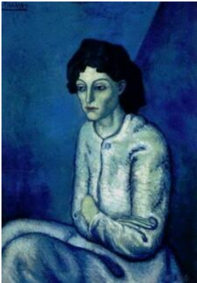
12. Femme Aux Bras Croises (1902)