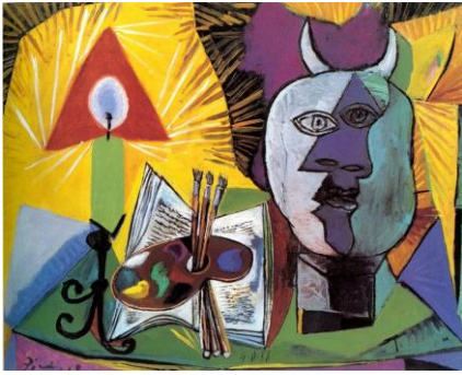
7. "Bougie, palette, Tête de Minotaure". 1938