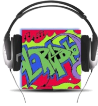
ΕΠΙΣΤΗΜΟΝΙΚΗ ΕΤΑΙΡΕΙΑ «European School Radio, Το Πρώτο Μαθητικό Ραδιόφωνο»