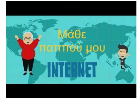
Αργυρόπουλος Άγγελος, Αργυρού Χρυσάνθη, Σούλι Ιρφάν Τάξη Α'