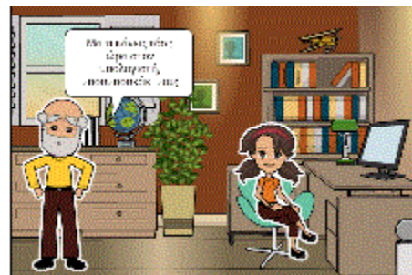
Κούση Ιωάννα, Τάξη Γ Ο παππούς κάνει live streaming