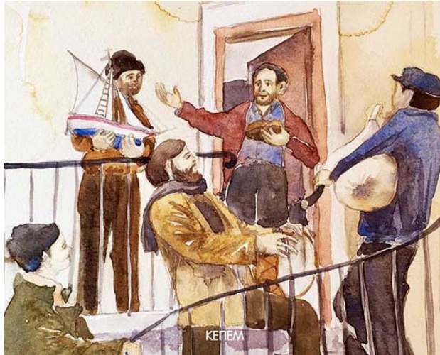
Τα κάλαντα, σε πολλά χωριά της Θράκης, λέγονται από τα παλικάρια του χωριού βραδινές ώρες συνήθως με συνοδεία γκαίντας.

Τα πιο συνηθισμένα φαγητά πάνω στο στρωμένο τραπέζι της Παραμονής των Χριστουγέννων ήταν η πίτα, το μέλι, το κρασί για να απλώσει η οικογένεια σαν την κληματαριά, το σαραγλί για να φερόμαστε πάντα γλυκά τους επισκέπτες μας, το καρπούζι για να είναι γλυκιά η οικογένεια αλλά και η παραγωγή πλούσια σαν τα σπόρια από το καρπούζι. Το πεπόνι, το μήλο για να έχουν τα μέλη της οικογένειας κόκκινα μάγουλα, το σκόρδο για να προστατεύονται από τα τσιμπήματα των εντόμων, το κρεμμύδι για να έχουν οι λεχώνες πολύ γάλα.