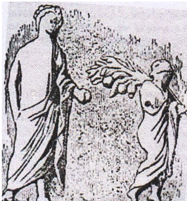
Νέος μεταφέρει την Ειρεσιώνη.

Τα δε τραγούδια αριθμούν μερικές δεκάδες και τραγουδιούνται χορωδιακά από δύο ομάδες και αποκλειστικά από άνδρες.