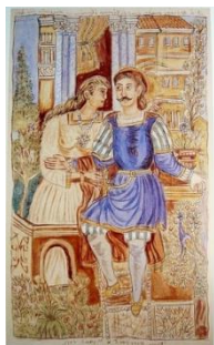
Ο Ερωτόκριτος και η Αρετούσα σε πίνακα του Θεόφιλου