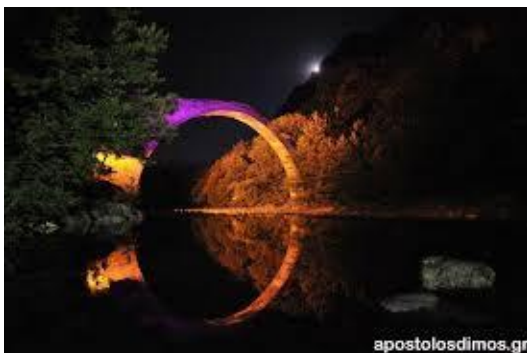
Το Γεφύρι της Κόνιτσας.

Στην ίδια θέση έστεκε παλιότερα, το 1823, ένα ξύλινο γεφύρι, το οποίο όμως δεν άντεξε την ορμή του ποταμού και καταστράφηκε πολύ σύντομα. Το σημερινό πέτρινο γεφύρι, βομβαρδίστηκε το 1913 από τον Οθωμανό Τσαβίτ Πασά, που προσπάθησε έτσι να ανακόψει την προέλαση των Ελληνικών στρατευμάτων. Όμως, οι βολές των κανονιών του Τούρκου Πασά δεν βρήκαν στόχο και έτσι το γεφύρι παρέμεινε όρθιο στη θέση του. Στις ζημιές που υπέστη τότε, συμπεριλαμβάνεται η καταστροφή των τριών διαφορετικών σε μέγεθος κουδουνιών, που υπήρχαν κρεμασμένα στη μέση του τόξου.