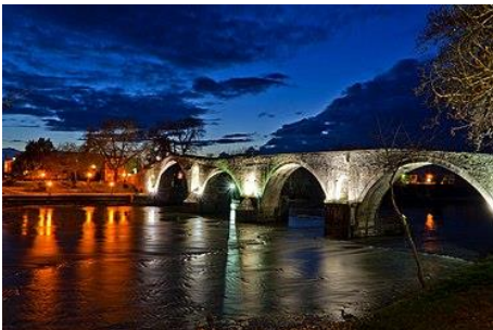
Το Γεφύρι την νύχτα

Το πέτρινο γεφύρι της Άρτας είναι το πιο ξακουστό στην Ελλάδα και αυτό το οφείλει στον θρύλο για τη θυσία της γυναίκας του πρωτομάστορα. Η αρχική κατασκευή του γεφυριού τοποθετείται στα χρόνια της κλασικής Αμβρακίας επί βασιλέως Πύρρου Α'. Αυτό είναι φυσικό, δεδομένου ότι σε αυτά τα μέρη αναπτύχθηκε αξιόλογος πολιτισμός από τα προχριστιανικά ακόμη χρόνια. Συνεπώς, οι αρχαίοι Αμβρακιώτες είχαν ανάγκη να κατασκευάσουν στο σημείο αυτό κάποιο πέρασμα, έργο που ασφαλώς θα βελτιωθεί στα ελληνοιστικά χρόνια, όταν ο βασιλιάς Πύρρος Α' έκανε την Αμβρακία πρωτεύουσα του κράτους του και ακόμη αργότερα στα ρωμαϊκά χρόνια. Τη σημερινή του μορφή, το Γεφύρι της Άρτας απέκτησε τα έτη 1602-1606 μ.Χ. Οι πληροφορίες αναφέρουν ότι τη χρηματοδότηση της κατασκευής του Γεφυριού της Άρτας έγινε από έναν Αρτινό παντοπώλη, τον Ιωάννη Θιακογιάννη ή Γυφτοφάγο, ο οποίος προφανώς είχε εμπορικές δραστηριότητες.