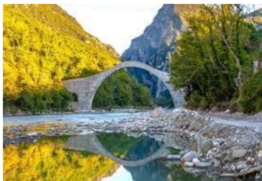
Το Γεφύρι την Άνοιξη.