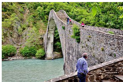
Τουρίστες στο Γεφύρι της Πλάκας.

κάμαρας 40 μέτρα, ύψος 21 μέτρα και με άνοιγμα στην κορυφή 3,2 μέτρα. Θεωρείται το μεγαλύτερο μονότοξο γεφύρι των Βαλκανίων και το τρίτο μεγαλύτερο στην Ευρώπη. Κατέρρευσε τρεις φορές, το 1860, το 1863 και το 2015. Μετά την κατάρρευση του 2015, η ανακατασκευή του δρομολογήθηκε αμέσως μετά και το κυριότερο μέρος του έργου ολοκληρώθηκε στις 4 Δεκεμβρίου 2019.