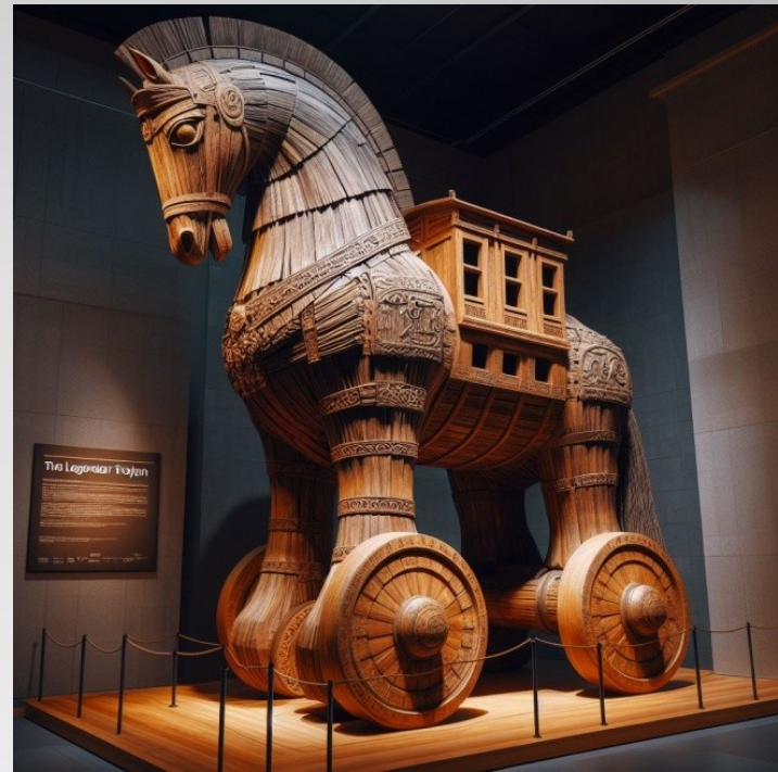
Κωνσταντίνος – Αργύρης – Σάββας