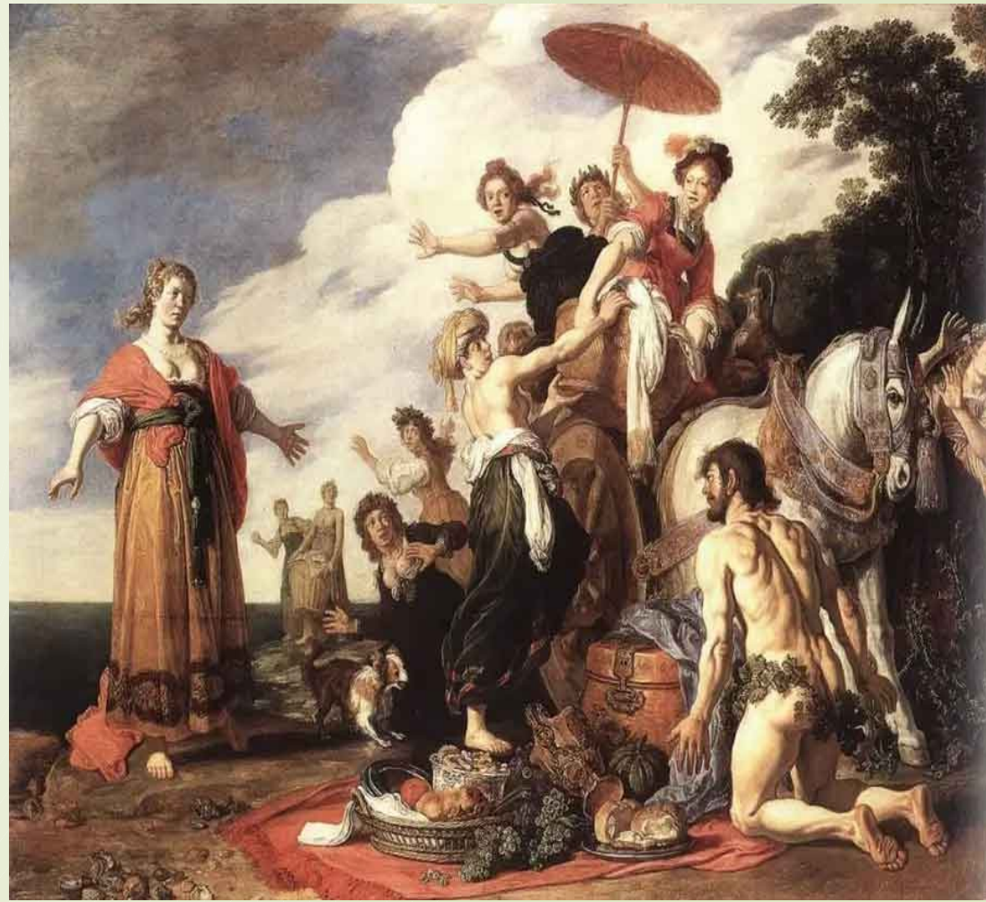
Οδυσσεας και Ναυσικά Amberger Christoph, 1619