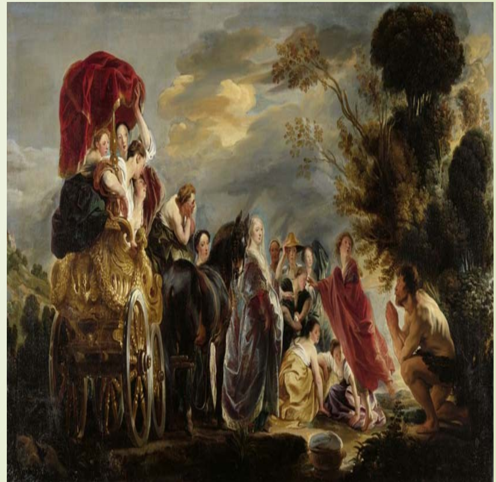
Συνάντηση Οδυσσέα και Ναυσικάς Jacob Jordaens (I), περίπου 1630-1640 Άμστερνταμ, Rijksmuseum, SK-C-1744