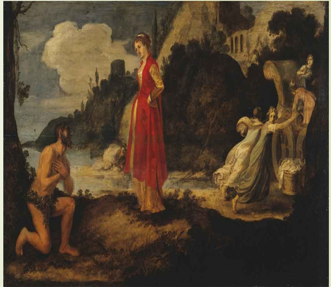
Οδυσσέας και Ναυσικά Rynas, Jan Symonisz, 1630-31 Αγ. Πετρούπολη, Ερμιτάζ