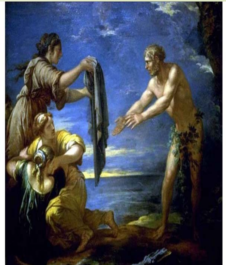
Οδυσσέας και Ναυσικά Καλλιτέχνης μετά τον Rosa Salvator, 1655 Los Angeles County Museum of Art

-Σε ευχαριστώ! Πάμε τώρα να παίξουμε στην αυλή!