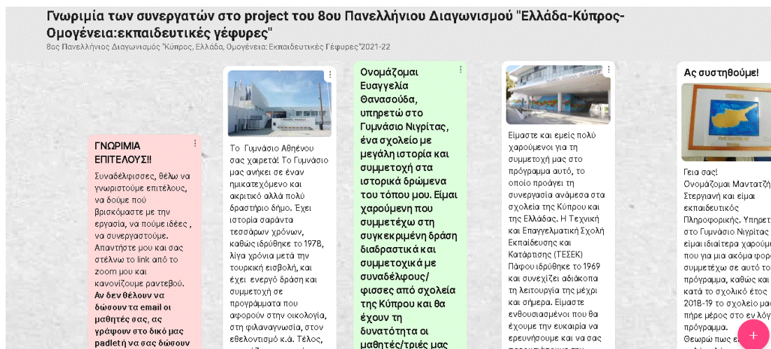
Εικόνα 2: Τα συμμετέχοντα σχολεία κάνουν μία σύντομη ιστορία του προφίλ τους