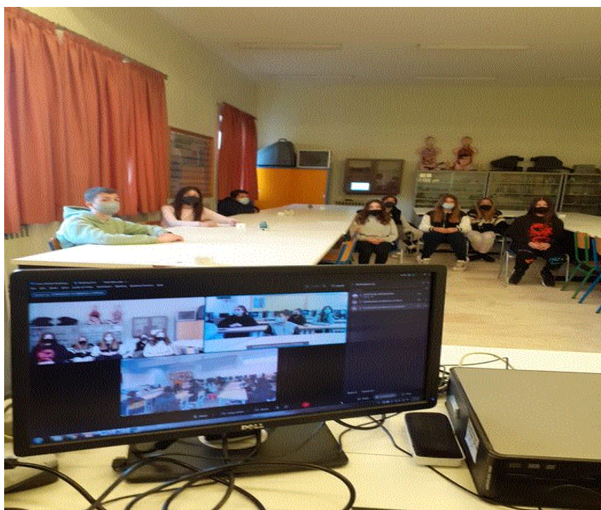
Εικόνα 3: Διαδικτυακή συνάντηση των συμμετεχόντων μαθητών στο ομαδοσυνεργατικό, πρόγραμμα (project)