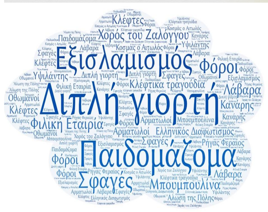
Ψηφιακή δημιουργία της μαθήτριας της Γ τάξης Παπακωνσταντίνου Αναστασίας ,μέσω word art