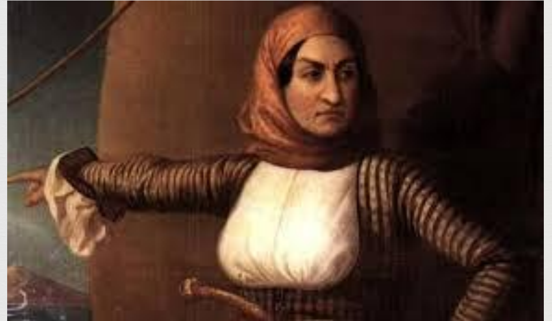
Ελαιογραφία που απεικονίζει την Μπουμπουλίνα . Εθνικό Ιστορικό Μουσείο.