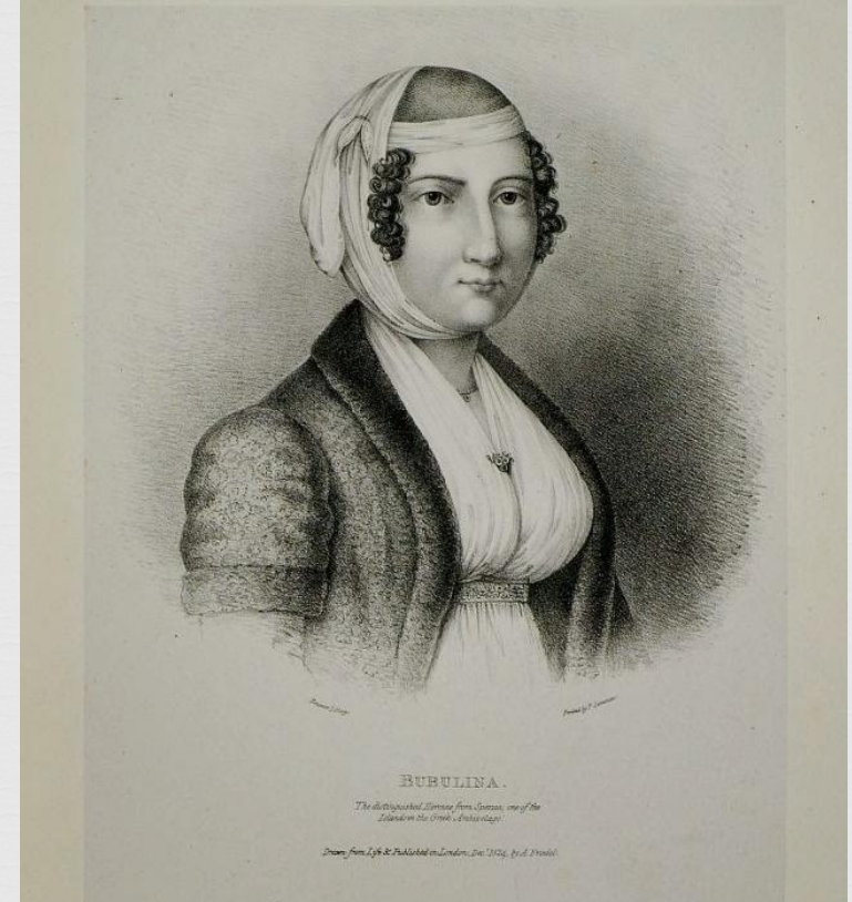
Adam Friedel, Λασκαρίνα Μπουμπουλίνα . Από το βιβλίο του Friedel με 24 προσωπογραφίες-λιθογραφίες προσωπικοτήτων της ελληνικής επανάστασης που εκδόθηκε το 1832.

Ιστορικό θεατρικό έργο του συγγραφέα Τάκη Λάππα με τίτλο: "Η μεγάλη κυρά" (1962). Το θεατρικό έργο (τεσσάρων σκηνών) αναφέρεται σε ένα περιστατικό της ζωής της ηρώιδας της Ελληνικής Επανάστασης του 1821 Λασκαρίνας Μπουμπουλίνας. Βρισκόμαστε στις Σπέτσες το 1825. Ο γιός της Μπουμπουλίνας Γιώργος Γιάννουζας σκέφτεται να παντρευτεί την Βγενή Κούτση, την αγαπημένη του. Στέλνει την μητέρα του να ζητήσει το χέρι της από τον πατέρα της νύφης Χριστόδουλο Κούτση.