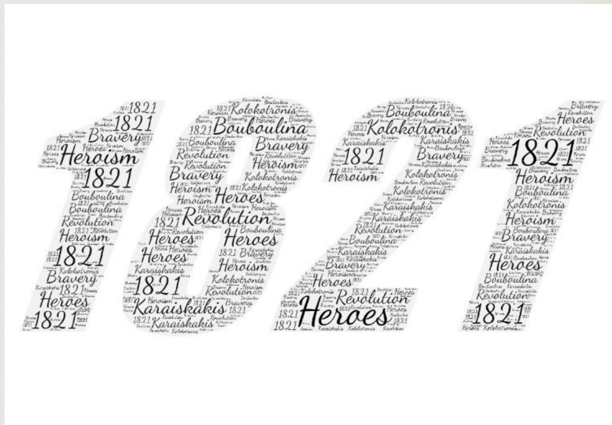
Ψηφιακές δημιουργίες του μαθητή της Β΄ τάξης Νούλη Θεόδωρου μέσω word art