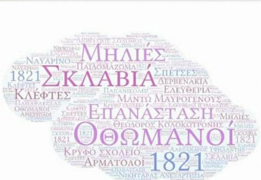
Ψηφιακή δημιουργία της μαθήτριας της Γ τάξης Ματζάρη Γεωργίας ,μέσω word art