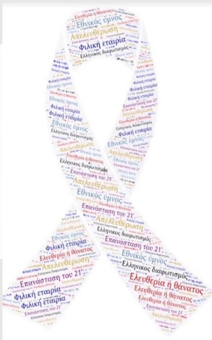
Ψηφιακή δημιουργία της μαθήτριας της Γ τάξης Ντόκα Στέλλας ,μέσω word art