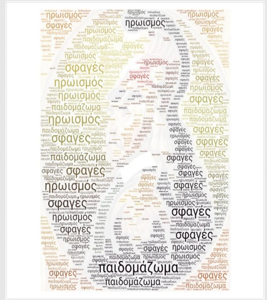
Ψηφιακή δημιουργία μέσω word art του μαθητή της Β' τάξης Αχλάδα Αθανασίου