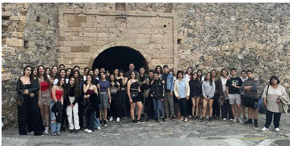
Εικόνα 6 Ξενάγηση στο Κάστρο

Στις 15 Μαΐου, υποδεχτήκαμε στο σχολείο μας τις ομάδες των Γυμνασίων Σπάτων, Αρτέμιδας και Κυπαρισσίας με στόχο τη γνωριμία και τη συνεργασία των παιδαγωγικών ομάδων και την ανάδειξη πρακτικών προσέγγισης λογοτεχνικών κειμένων. Εκεί, όλοι μαζί, κάναμε παιχνίδια γνωριμίας, παρουσιάσαμε τα βιβλία με τα οποία ασχοληθήκαμε και συζητήσαμε για τα βιβλία και τους τρόπους προσέγγισης των θεμάτων των βιβλίων και χαρακτήρων που συμμετέχουν. Στο τέλος χορέψαμε (φυσικά!).