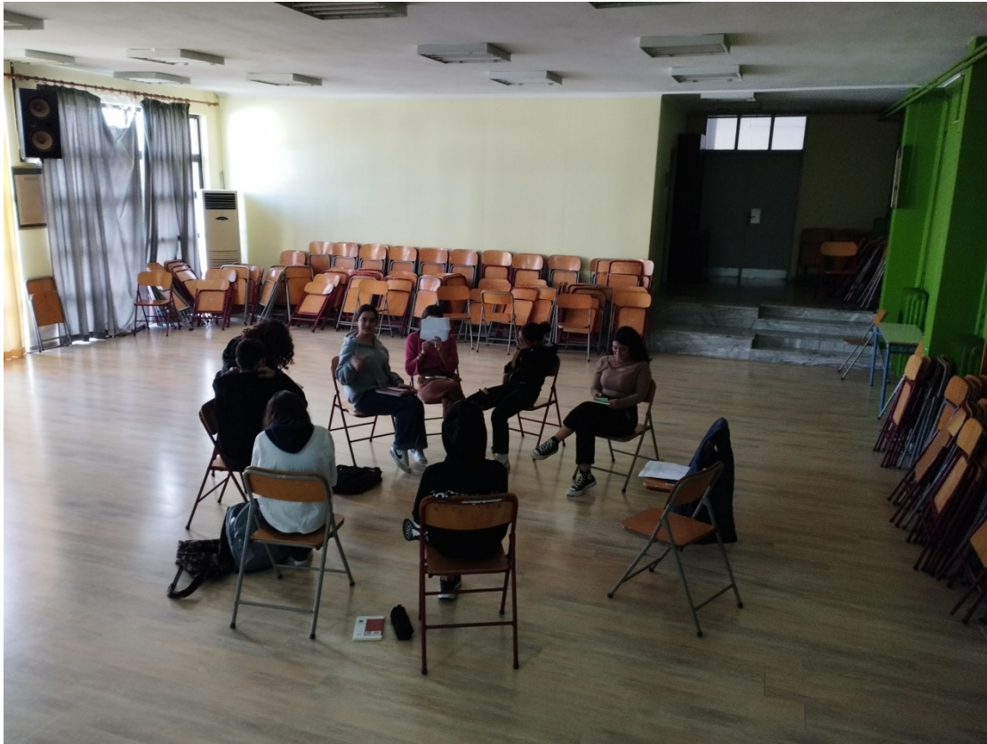
Εικόνα 2 Η ομάδα μας κατά τις συναντήσεις μας

Στη συνέχεια, αρχίσαμε να διαβάζουμε όλοι και όλες μαζί τα κεφάλαια του βιβλίου «Ζουμ» της Ζώρζ Σαρή. Το συγκεκριμένο βιβλίο επελέγη καθώς συνδύαζε δύο παράλληλες ιστορίες, πολλούς παράλληλους ρόλους, δύο μυστήρια και πολλαπλά αφηγηματικά επίπεδα. Αυτή ακριβώς η ποικιλία αποτελούσε τη δυσκολία και συνάμα τη γοητεία της δουλειάς μας. Κατά τη διάρκεια των συναντήσεων του Ιανουαρίου, παράλληλα με τη μελέτη του βιβλίου και των χαρακτήρων του, αρχίσαμε να συζητάμε τη δημιουργία επιμέρους ομάδων, ανάλογα με τα ενδιαφέροντά μας. Έτσι, δημιουργήθηκαν τρεις ομάδες: ομάδα βιβλιοπαρουσίασης, ομάδας εικαστικών και ομάδα εκφραστικής ανάγνωσης. Για τον καλύτερο συντονισμό των δράσεων και την καλύτερη συνεργασία των μελών των ομάδων, αποφασίσαμε να εργαζόμαστε και εξ αποστάσεως με τη χρήση συνεργατικών εργαλείων της Google. Παράλληλα, δημιουργήθηκε μία κυψέλη στην πλατφόρμα e-me με στόχο να λειτουργήσει ως αποθετήριο του παραγόμενου υλικού.