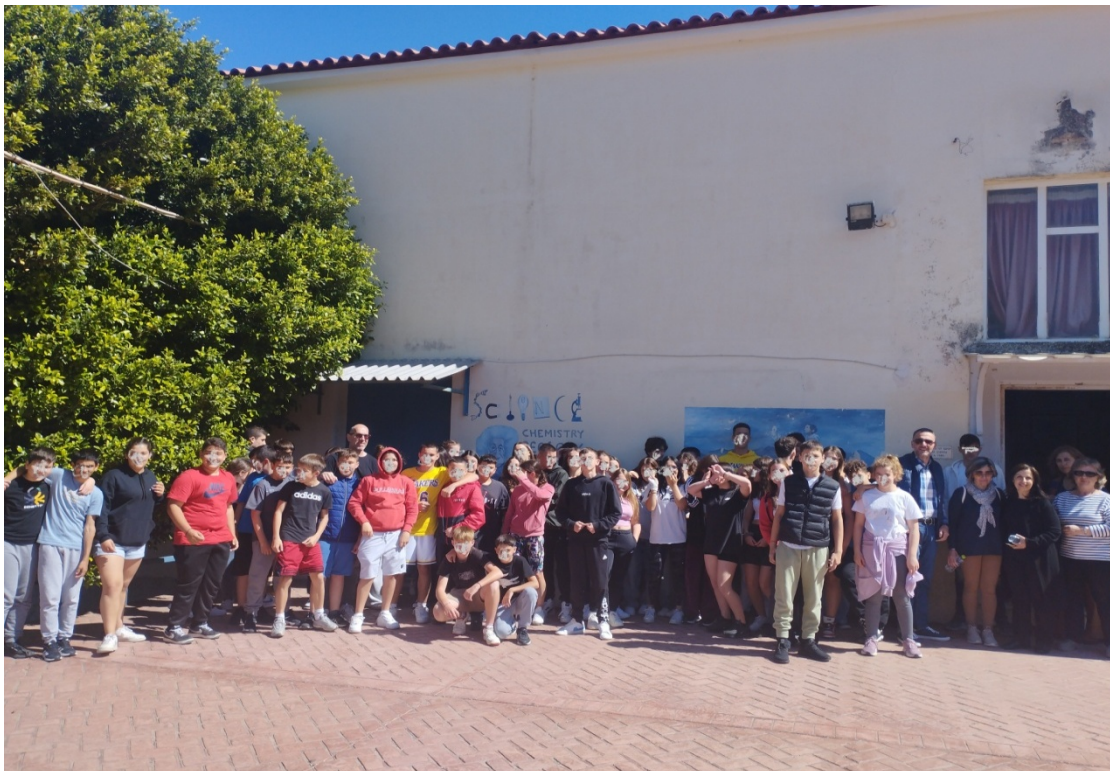
Εικόνα 5 Επίσκεψη στο Γυμνάσιο Κυπαρισσίας

Στις 10 Απριλίου φιλοξενηθήκαμε από το Γυμνάσιο Κυπαρισσίας και συζητήσαμε με την αντίστοιχη ομάδα του σχολείου αυτού.