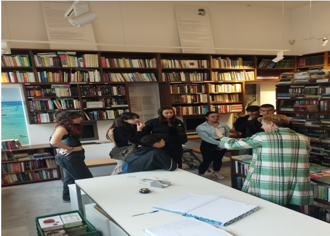
Εικόνα 4 Επίσκεψη στην Καψάλειο Δημοτική βιβλιοθήκη Γυθείου

Στις 10 Απριλίου φιλοξενηθήκαμε από το Γυμνάσιο Κυπαρισσίας και συζητήσαμε με την αντίστοιχη ομάδα του σχολείου αυτού.