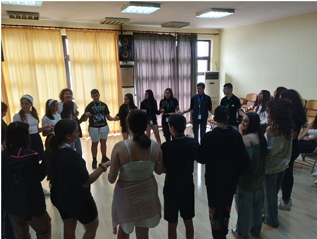
Εικόνα 8 Παιχνίδια γνωριμίας