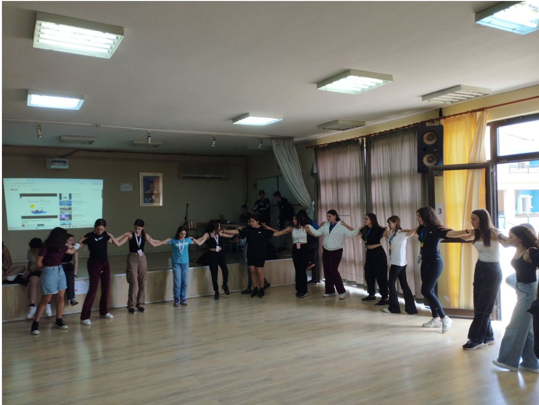
Εικόνα 10 Κλείσιμο της συνάντησης με παραδοσιακούς χορούς

Τέλος, σχεδιάζεται η συμμετοχή του προγράμματός μας στην εκδήλωση λήξης του σχολικού έτους, η οποία θα πραγματοποιηθεί στις 19 Ιουνίου στον χώρο του σχολείου μας με καλεσμένους τους συμμαθητές μας και τις συμμαθήτριές μας, τους γονείς μας και άτομα – μέλη της τοπικής κοινωνίας.