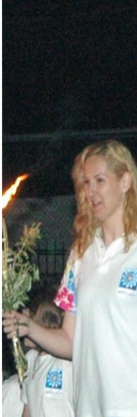
Τασούλα Κελεσίδου Ολυμπιονίκης