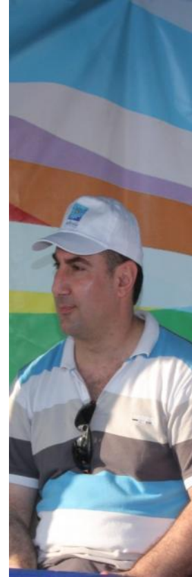
Κάχι Καχιασβίλι Ολυμπιονίκης