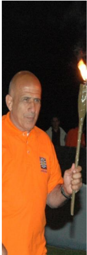
Πέτρος Γαλακτόπουλος Ολυμπιονίκης