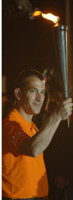
Πύρρος Δήμας Ολυμπιονίκης