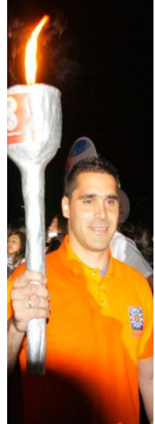
Χαράλαμπος Ταϊγανίδης Παραολυμπιονίκης