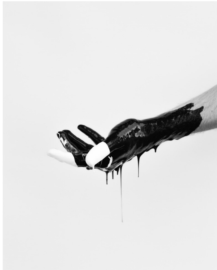
Χριστίνα Δεμερτσίδου, Hands of Photographers