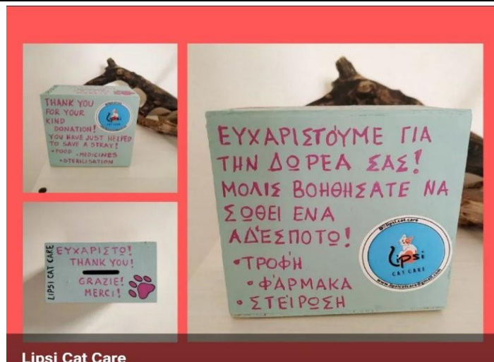
Lipsi Cat Care

Εάν αγαπάτε τα ζώα μπορείτε να βοηθήσετε και εσείς, προσφέροντας όχι μόνο οικονομική βοήθεια και ζωοτροφές