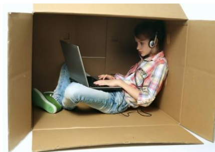
Παναγιώτα Σκούμπη, Β2

αθλητισμό και την μουσική είναι μία αξιοσημείωτη λύση. Οι νέοι μπορούν να βρουν τον δρόμο τους και να σκεφτούν σωστά, αρκεί να τους δώσεις τις κατάλληλες συμβουλές, τα σωστά ερεθίσματα και τα κίνητρα για να το κάνουν. Εάν λοιπόν επιλέξουν συνετά και ορθά, μόνο ωφέλιμα θα είναι τ' αποτελέσματα, καθώς θα διδαχτούν και θα ανοίξουν νέοι ορίζοντες μπροστά τους.