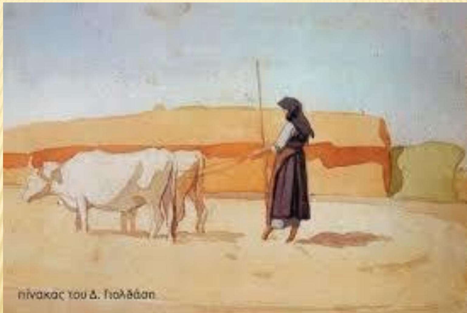
πίνακας του Δ. Πολιτιάση