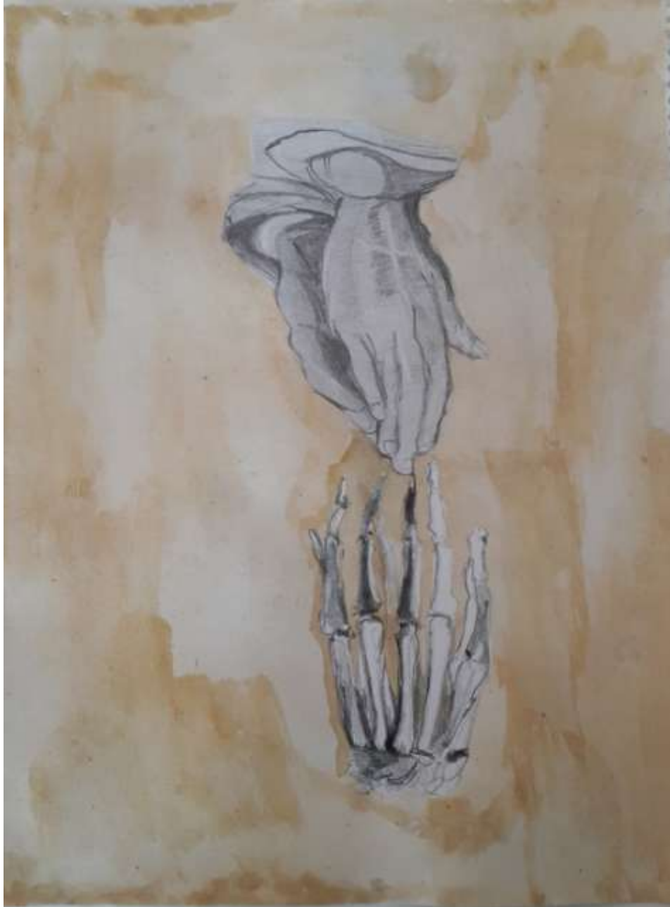
Σχέδιο με χρώμα του μαθητή Μανώλη-Γιάννη Βεντούρη