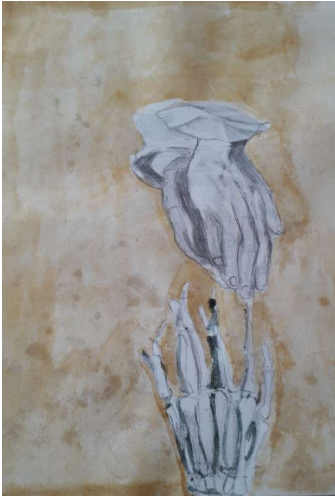
Σχέδιο με χρώμα του μαθητή Γιάννη Ελζαχεντ