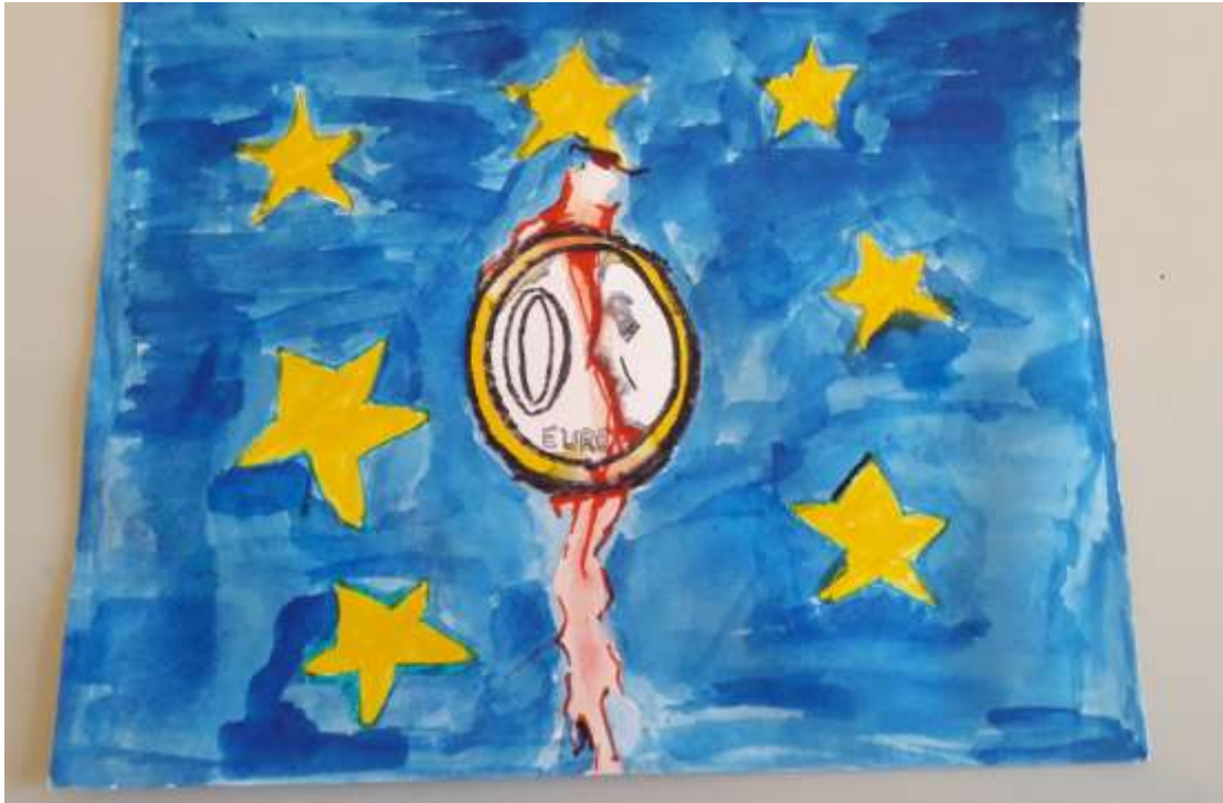
Μανώλης Γιάννης Βεντούρης