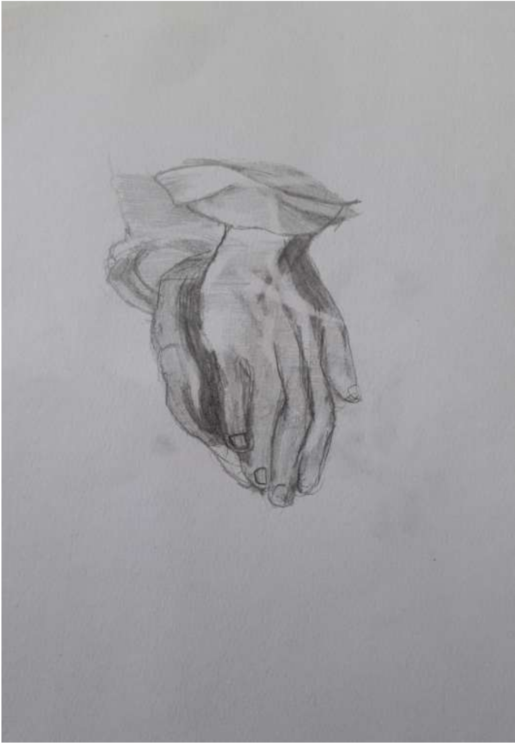
Σχέδιο του Γιάννη Ελ Ζαχεντ