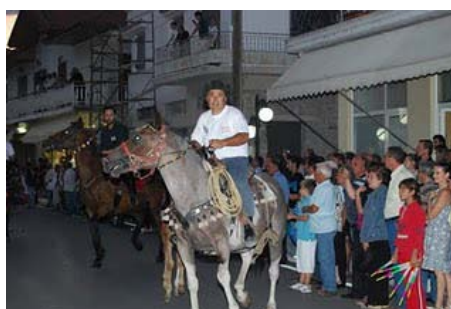
Στο πανηγύρι της Κατερινιώτισσας στις 8 Σεπτεμβρίου

Όπως κάθε χρόνο το χωριό μας κάνει διάφορες δραστηριότητες στα παζάρια. Φέτος όμως το πρόγραμμα ήταν πιο εμπλουτισμένο από άλλες χρονιές. Ο σύλλογος διοργάνωσε θεατρικά έργα, χορούς, αγώνες ράλι και το πιο εντυπωσιακό ήταν το «ζωοπάζαρο». Το απόγευμα που θα περνούσαν τα άλογα βγήκε όλος ο κόσμος έξω στο δρόμο, στα μπαλκόνια και στα πεζοδρόμια για να απολαύσουν αυτό το υπέροχο θέαμα.