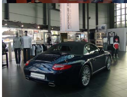
Από τη "boutique" της Porsche....