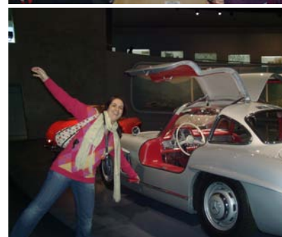
Από το Μουσείο της Mercedes....