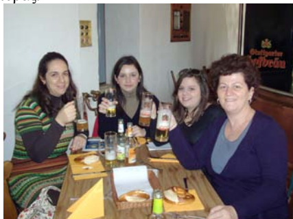
Δοκιμάζοντας μπίρα light με γεύσεις φρούτων

Τις επόμενες ημέρες ξεναγηθήκαμε στην πόλη και επισκεφτήκαμε διάφορα μουσεία, όπως το μουσείο της Mercedes, το μουσείο Ιστορίας της πόλης, αλλά και ένα εργοστάσιο κατασκευής μπίρας.