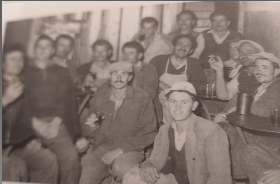
Γαλατινιώτες οικοδόμοι το 1957

Την ίδια εποχή οι Γαλατινιώτες άρχισαν να ξενιτεύονται και να εγκαθίστανται, πολλές φορές οριστικά, στην Ανατολική Μακεδονία, κυρίως στη Νιγρίτα (όπου κατά την περίοδο του Μεσοπολέμου σχηματίστηκε ισχυρή Γαλατινιώτικη παροικία) και στη Θεσσαλονίκη. Εκεί άρχισαν να μεταναστεύουν μαζικά από το 1950 και μετά και να ασχολούνται με την οικοδομική τέχνη και την εργολαβία οικοδομών.