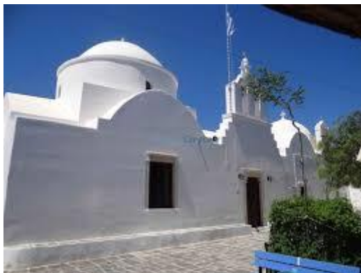
Η εκκλησία του Αγίου Νικολάου

Η θεία λειτουργία της Πρωτοχρονιάς γίνεται στην κεντρική εκκλησία του Αγίου Νικολάου , πλατεία Δουνάβων.