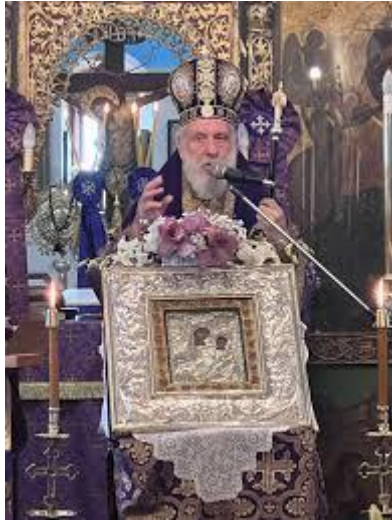
Η εικόνα της Μαρτιάτισσας με τον Σεβασμιότατο Μητροπολίτη Δωρόθεο.

Σεβασμιότατος Μητροπολίτης Σύρου Δωρόθεος. Ακολουθεί η περιφορά της εικόνας της Παναγίας της Μαρτιάτισσας στα στενά της Χώρας.