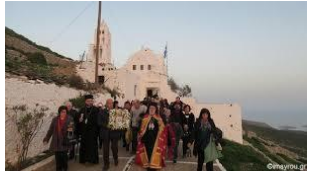
Η περιφορά της εικόνας