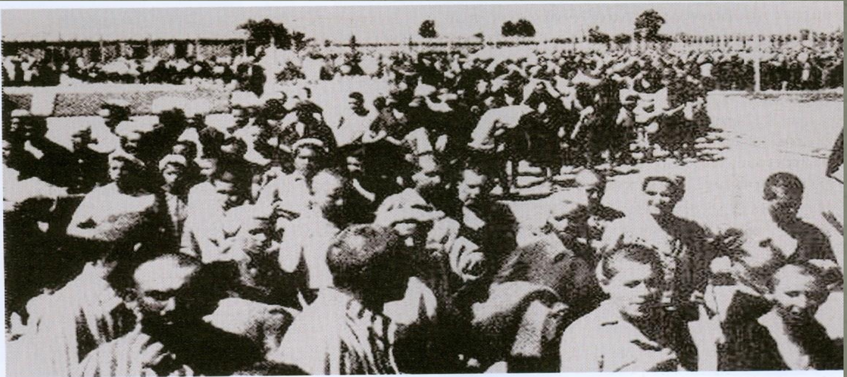
Το «τσιγγάνικο τρένο» φθάνει στο Αουσβιτς στα τέλη της άνοιξης του 1943 μεταφέροντας στο στρατόπεδο του θανάτου 20.000 Ρομά

Κυρίαρχα χαρακτηριστικά του καθεστώτος που επεδίωκαν επιβάλλουν Γερμανία - Ιταλία ήταν η οικονομική λεηλασία, η κατάπνιξη των ελευθεριών, οι εκκαθαρίσεις πληθυσμών. Μνημεία της ναζιστικής βαρβαρότητας τα στρατόπεδα συγκέντρωσης αποτελούν την εφαρμογή στην πράξη των «ιδανικών» της Αρίας φυλής. Σε αυτά Εβραίοι, Τσιγγάνοι, ομοφυλόφυλοι και πολιτικοί κρατούμενοι εξοντώνονται κατά χιλιάδες με ένα σύστημα που συνδυάζει επιστημονική μεθοδικότητα και υπαλληλική νοοτροπία.