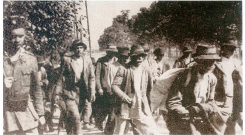
Τσιγγάνοι της Γιουγκοσλαβίας οδηγούνται στο στρατόπεδο συγκέντρωσης Γιασένοβατς της Κροατίας