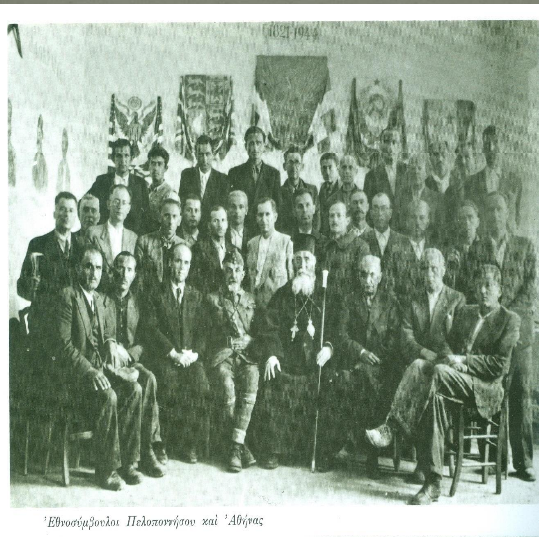
Ἐθνοσύμβουλοι Πελοποννήσου καὶ Ἀθήνας

Χαρακτηρίσαμε τη γνήσια αγάπη για την πατρίδα φυσική παρόρμηση. Χαρακτηρίσαμε τη διατεταγμένη αγάπη για το κράτος που επιβάλλουν οι κυβερνήσεις ένα νοσηρό υποκατάστατό. Το επιχείρημα: Εβδομήντα εκατομμύρια νεκροί σε δύο πολέμους, μέσα στο διάστημα μιας ανθρώπινης ζωής. Ἐσχατη πράξη πατριωτισμού: να τοποθετήσουμε την ανθρώπινη, οικουμενική δικαιοσύνη πάνω από τα εθνικιστικά συμφέροντα.