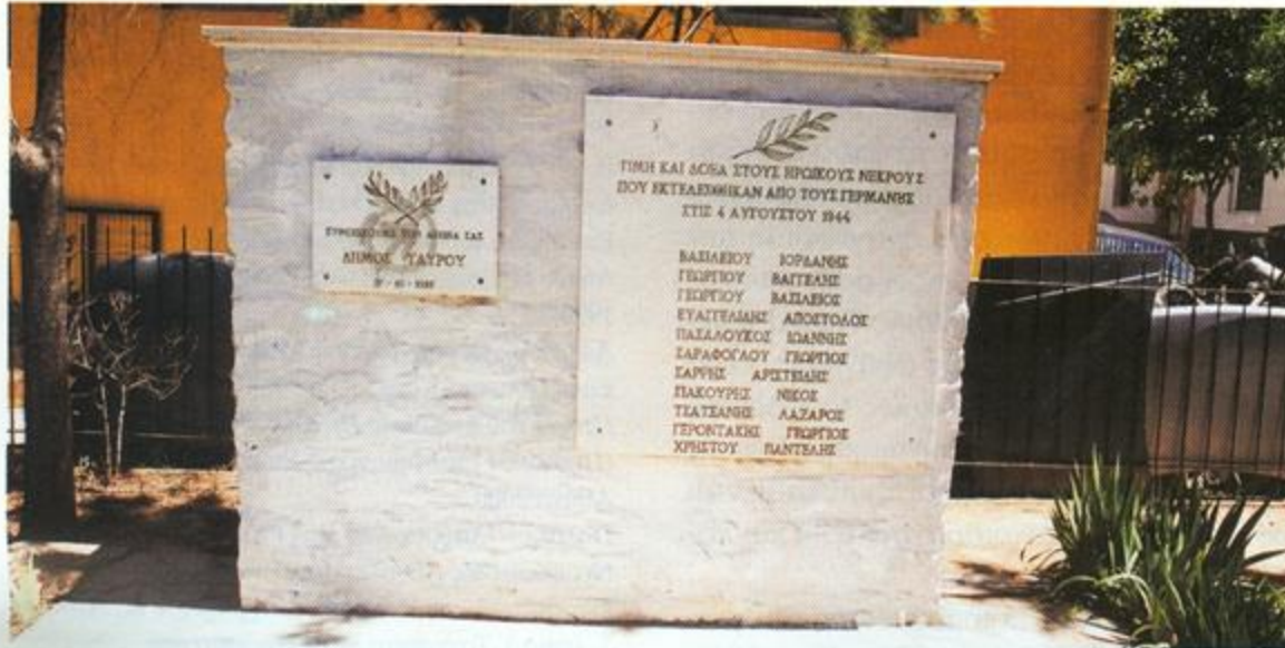
Μνημείο που έχει ανεγείρει ο Δήμος Ταύρου για τους Τσιγγάνους που εκτέλεσαν οι Γερμανοί στα Πετράλωνα το 1944 (Φωτογραφία Διον. Μοσχονάς)

Αν και αποκλεισμένοι από τον επίσημο ιστορικό λόγο, οι Ρομά, ως τμήματα της ελληνικής κοινωνίας δεν μπορεί παρά να ήταν παρόντες στις περιπέτειες και τους αγώνες της Αντίστασης. Η στάση τους δεν υπήρξε υπαγορευμένη από κάποια ιδιαίτερα χαρακτηριστικά, αλλά σύνθετη και πολύμορφη, ακριβώς όπως συνέβη με τους υπόλοιπους Έλληνες.