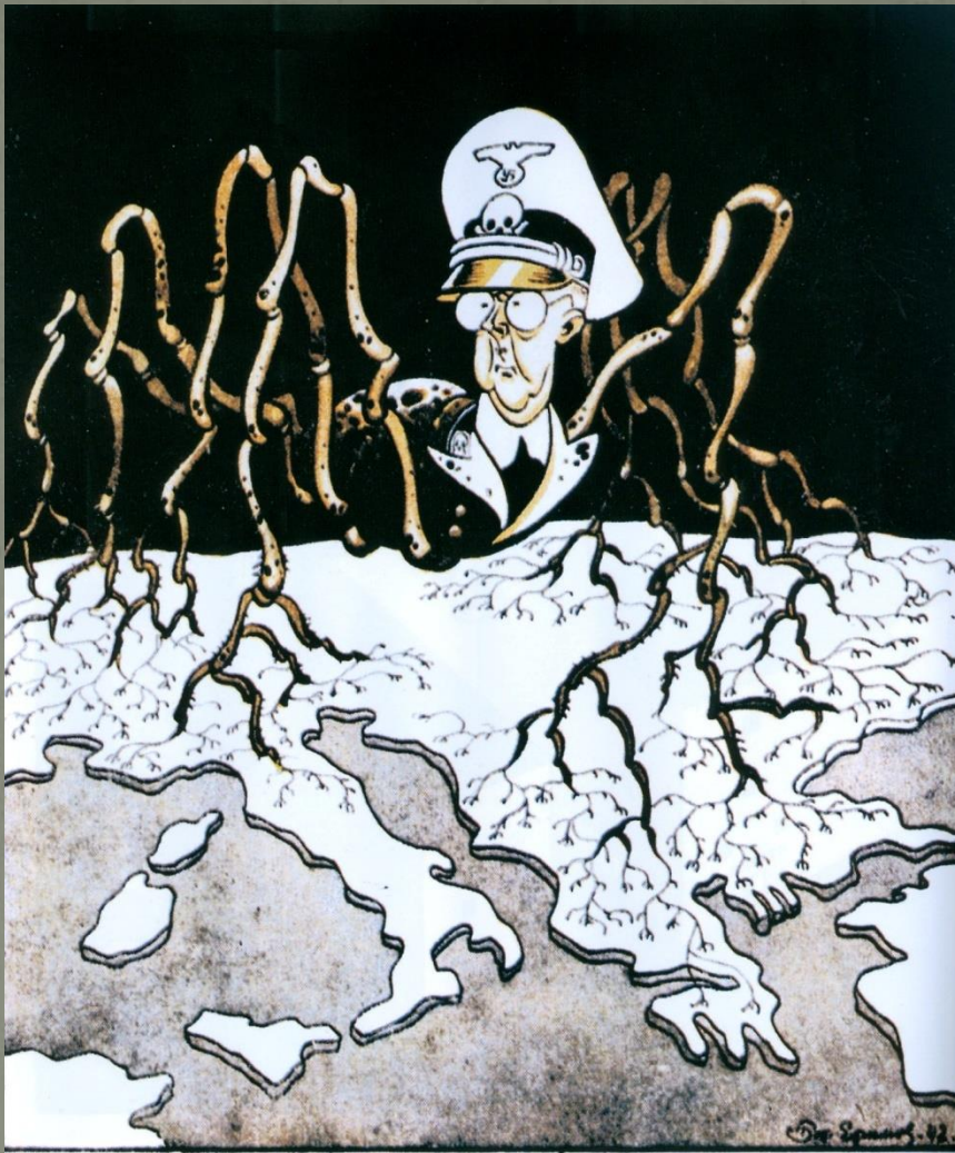
ΟΡΓΑΝΟ ΤΗΣ «ΝΕΑΣ ΤΑΞΗΣ» Σκίτσο του Χάινριχ Χίμλερ σαν αράχνη πάνω από την κεντρική Ευρώπη, την Ιταλία και την Ελλάδα. Του Μπορίς Εφίμοφ (1942)

Από την άλλη έχουμε τη διατεταγμένη αγάπη για το κράτος: κάτι που το επιβάλλουν κυβερνήσεις, ένα νοσηρό υποκατάστατό της φιλοπατρίας συνδυασμένο με τη ρηχή στάση ανωτερότητας απέναντι στο γείτονα. Μια μαζική ψευδαίσθηση ενάντια στις ιστορικά τεκμηριωμένες αντιλήψεις. Σε ολόκληρη την Ευρώπη δεν υπάρχει κανένα κράτος που να μην αποτελείται από μια συγκέντρωση λαών διαφορετικής καταγωγής που ενσωματώθηκαν σε κράτος από οικονομικά και πολιτικά συμφέροντα.