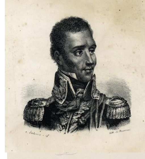
Jean Pierre Boyer