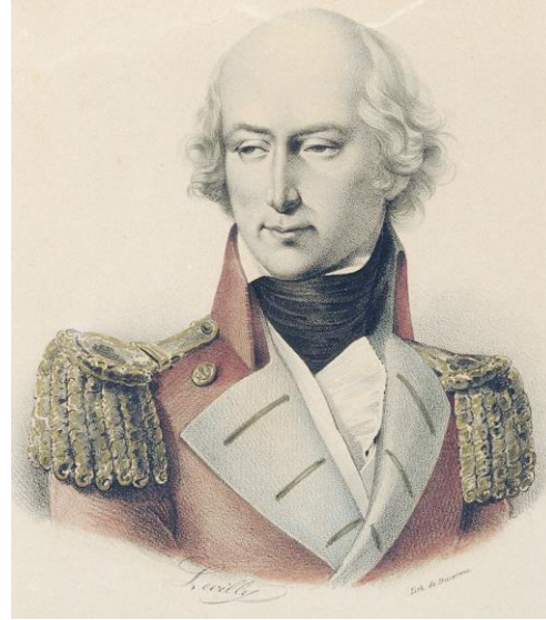
Ο Άγγλος ναύαρχος Edward Codrington