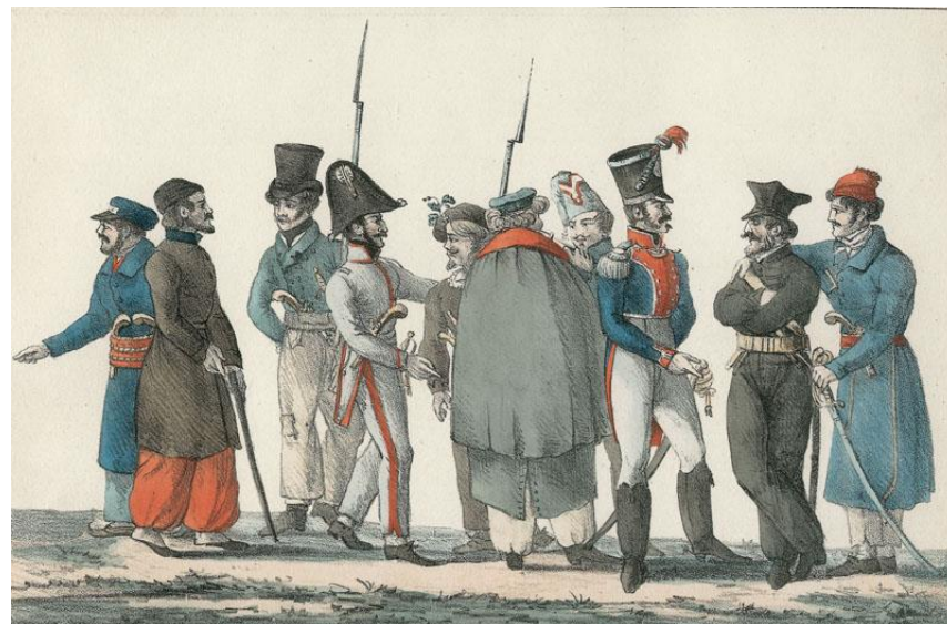
ΕΥΡΩΠΑΙΟΙ ΦΙΛΕΛΛΗΝΕΣ ΑΞΙΩΜΑΤΙΚΟΙ

Με την έναρξη της Ελληνικής επανάστασης και παρά την αρνητική αντίδραση των ευρωπαϊκών κυβερνήσεων, οι εκκλήσεις των αγωνιστών βρίσκουν γόνιμο έδαφος στις διαποτισμένες από το πνεύμα του φιλελευθερισμού κοινωνίες, με στόχο αρχικά τη συγκέντρωση ανθρωπιστικής βοήθειας και στη συνέχεια την έμπρακτη υποστήριξη του αγωνιζόμενου λαού σχηματίζονται φιλελληνικές επιτροπές .