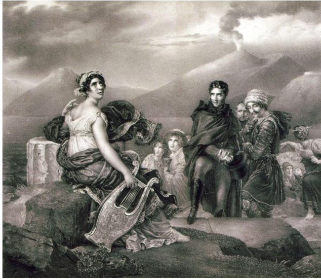
Ο Chateaubriand και η κυρία de Stael στο ακρωτήριο της Μεσσήνης