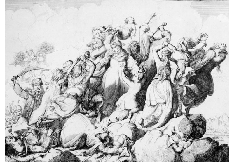
Ο χορός του Ζαλόγγου

Ο καλλιτεχνικός κόσμος δεν έμεινε αμέτοχος στις φιλελληνικές κινητοποιήσεις. Ιδιαίτερα οι Γάλλοι καλλιτέχνες βρήκαν στον αγώνα των Ελλήνων μια αστείρευτη, γεμάτη συμβολισμούς πηγή έμπνευσης, ταυτίζοντάς τον με την αιώνια πάλη του ατόμου για ελευθερία.