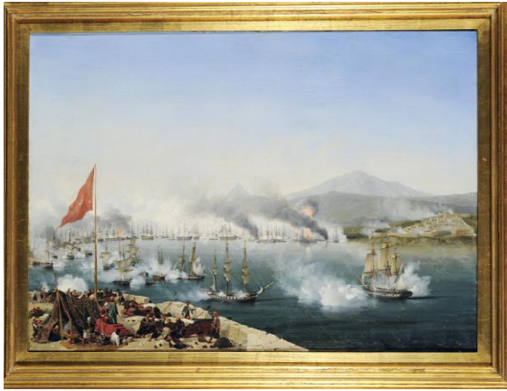
Η ναυμαχία του Ναβαρίνου