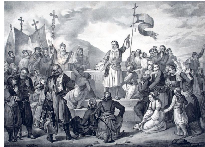
Ο όρκος του λόρδου Βύρωνα στον τάφο του Μάρκου