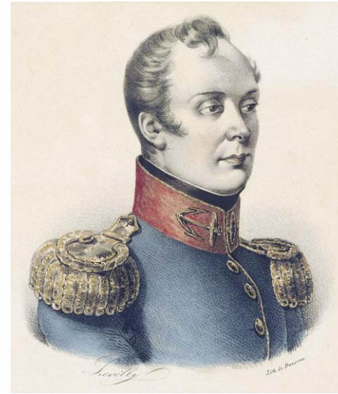
Ο Lodewijk van Heiden