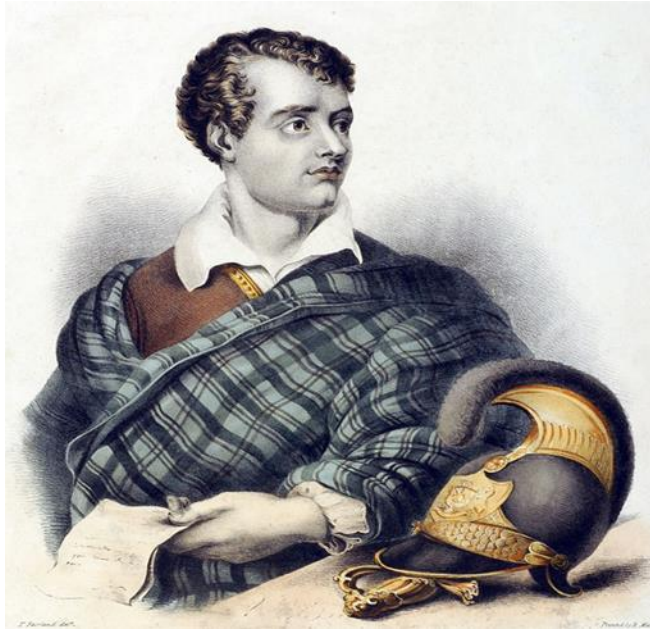
George Gordon Noël Byron