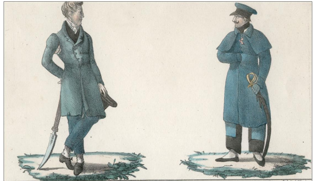
Jean de Targov Un des francs accourus au secours des Grecs, monta le premier le drapeau de la liberté à l'Alona.