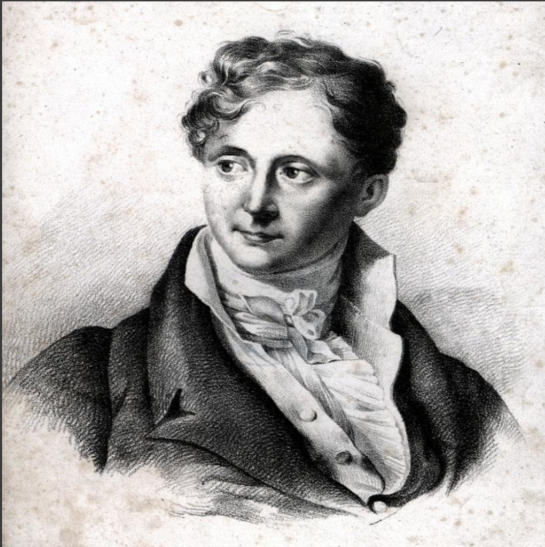
Jean-Gabriel Eynard Ελβετός τραπεζίτης-διπλωμάτης