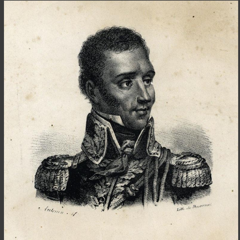
Jean-Pierre Boyer Πρόεδρος της Αϊτής