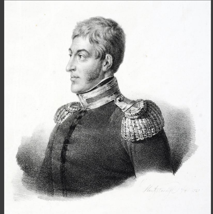
Frank Abney Hastings Βρετανός αξιωματικός του ναυτικού