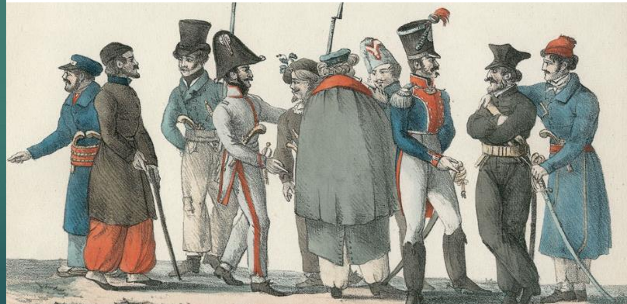
Ευρωπαίοι Φιλέλληνες Αξιωματικοί