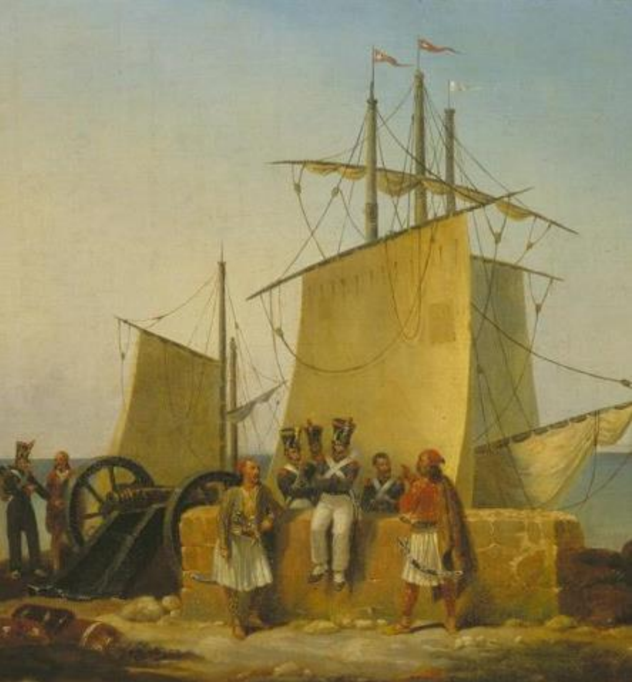
Ο Γαλλικός Στρατός στον Μωριά