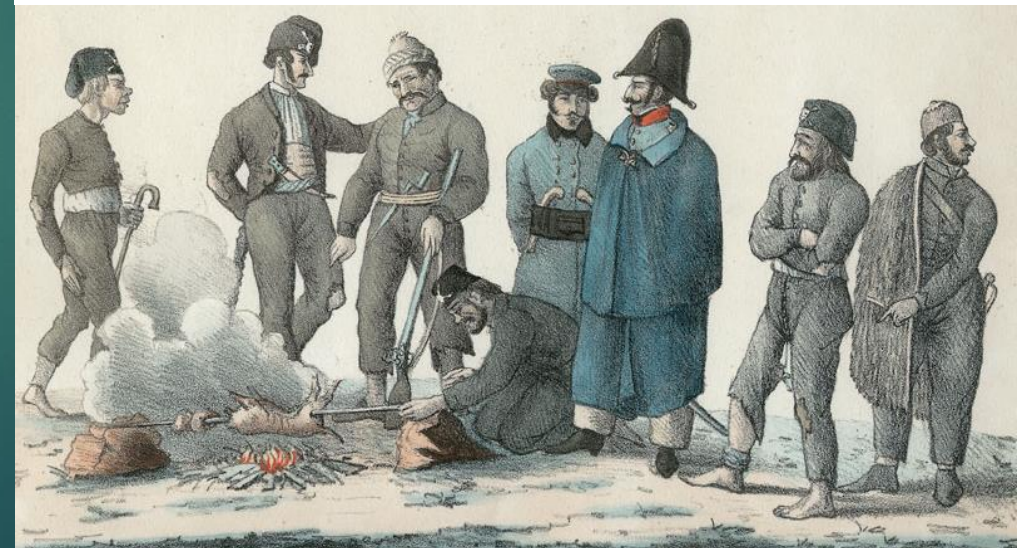
Ιερολοχίτες και Γάλλοι αξιωματικοί