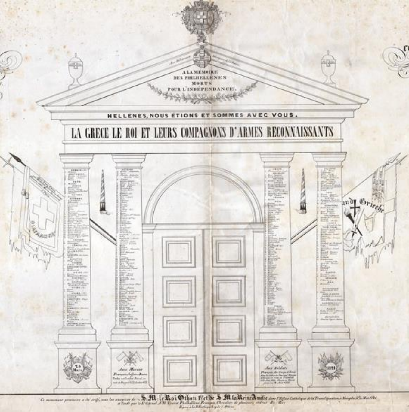
Μνημείο των Φιλελλήνων στο Ναύπλιο