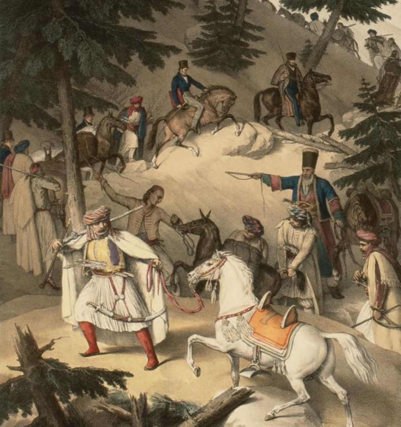
Περιηγητές διασχίζουν την Πίνδο