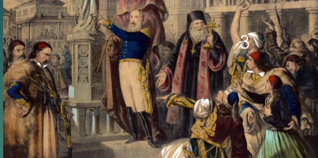
Ο Αλέξανδρος Υψηλάντης κηρύσσει την έναρξη της Ελληνικής Επανάστασης στις Παραδουνάβιες Ηγεμονίες