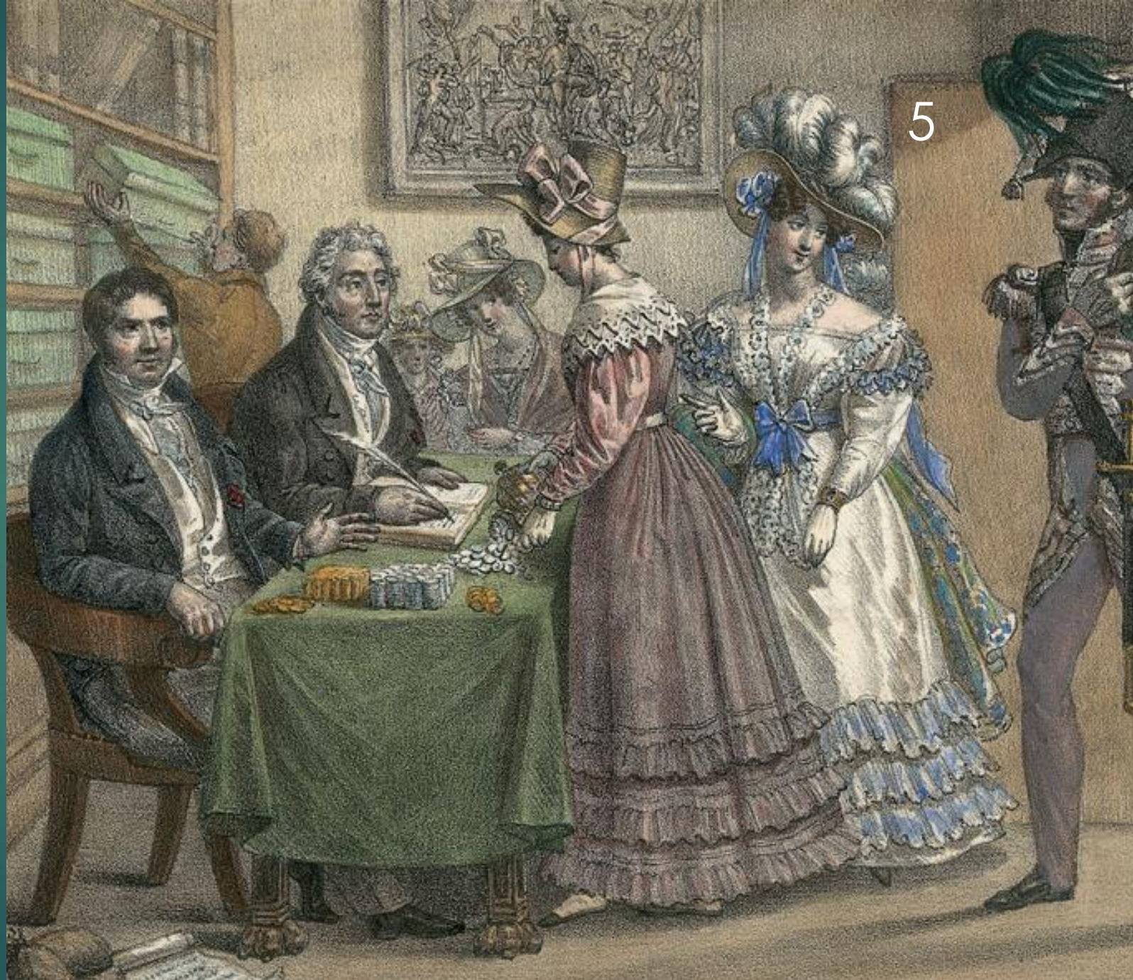
Έρανος υπέρ των Ελλήνων στη Γαλλία