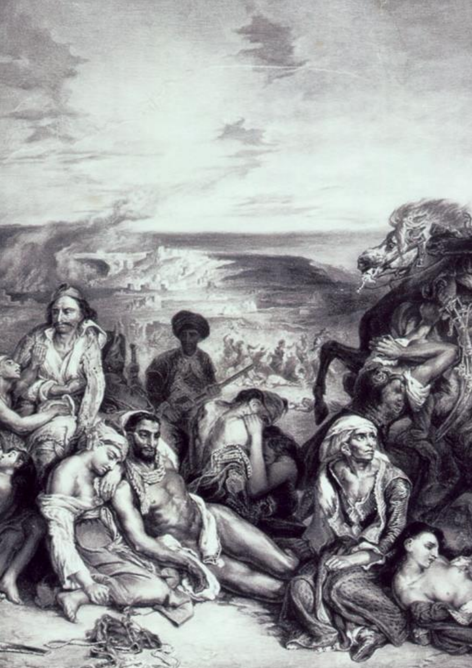
Η Σφαγή της Χίου