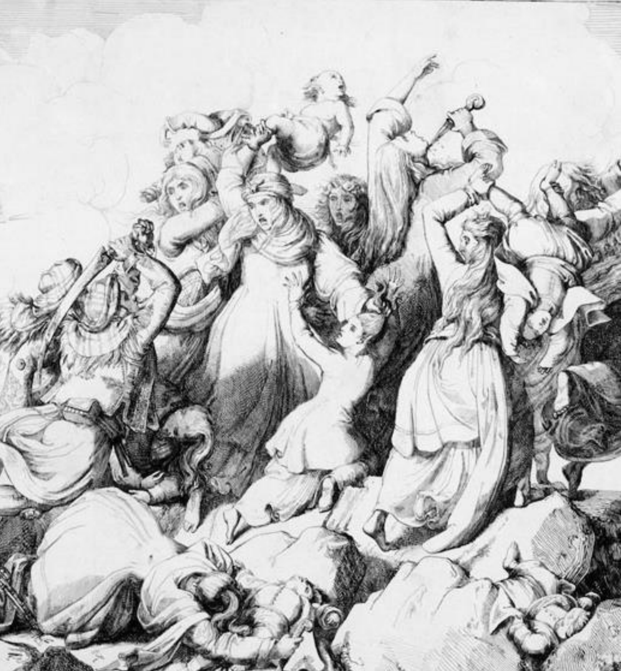
Ο Χορός του Ζαλόγγου