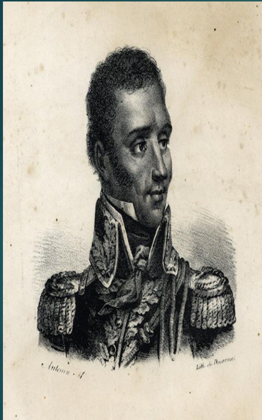
Jean Pierre Boyer.