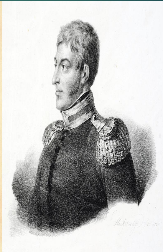
Frank Abney Hastings.