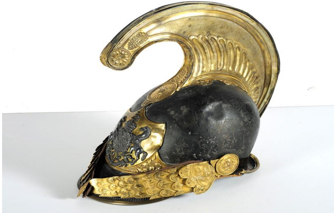
Η περικεφαλαία του Λόρδου Βύρωνα

Στην εικόνα βλέπουμε την περικεφαλαία του Λόρδου Βύρωνα ο οποίος ήταν ένας φιλέλληνας που συνεισέφερε στον αγώνα της ελληνικής επανάστασης αλλά τελικά πέθανε στο Μεσολόγγι το 1824.