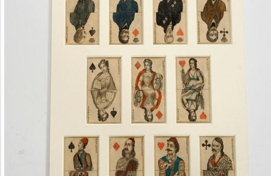
Βεντάλια με φιλελληνική παράσταση & Τραπουλόχαρτα με μορφές εμπνευσμένες από την ελληνική επανάσταση του 1821

Οι φιλέλληνες υποστήριζαν και βοηθούσαν τους Έλληνες κατά τη διάρκεια του ένοπλου αγώνα με πολλούς τρόπους. Ένας από αυτούς ήταν η ενίσχυση στην οικονομία. Αυτό επιτυγχάνονταν με τη πώληση διαφόρων αντικειμένων, όπως βεντάλιες, κούπες, τραπουλόχαρτα κ.α., τα οποία ήταν συνήθως διακοσμημένα με ζωγραφιές που απεικόνιζαν Έλληνες πολεμιστές.