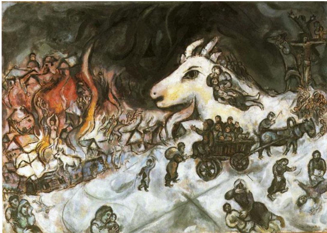
Marc Chagall, Πόλεμος. Μουσείο Μοντέρνας Τέχνης, Ζυρίχη.