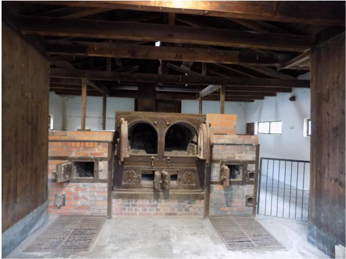
4. Άουσβιτς