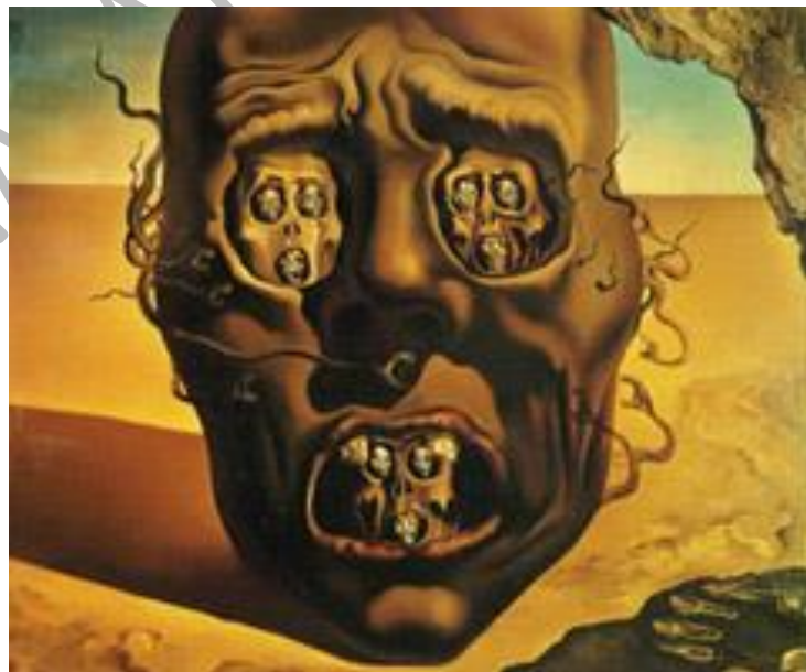
Salvador Dalí, Το πρόσωπο του πολέμου (1940). Μουσείο Μπντμανς Βαν Μπόινγκεν, Ρότερνταμ.