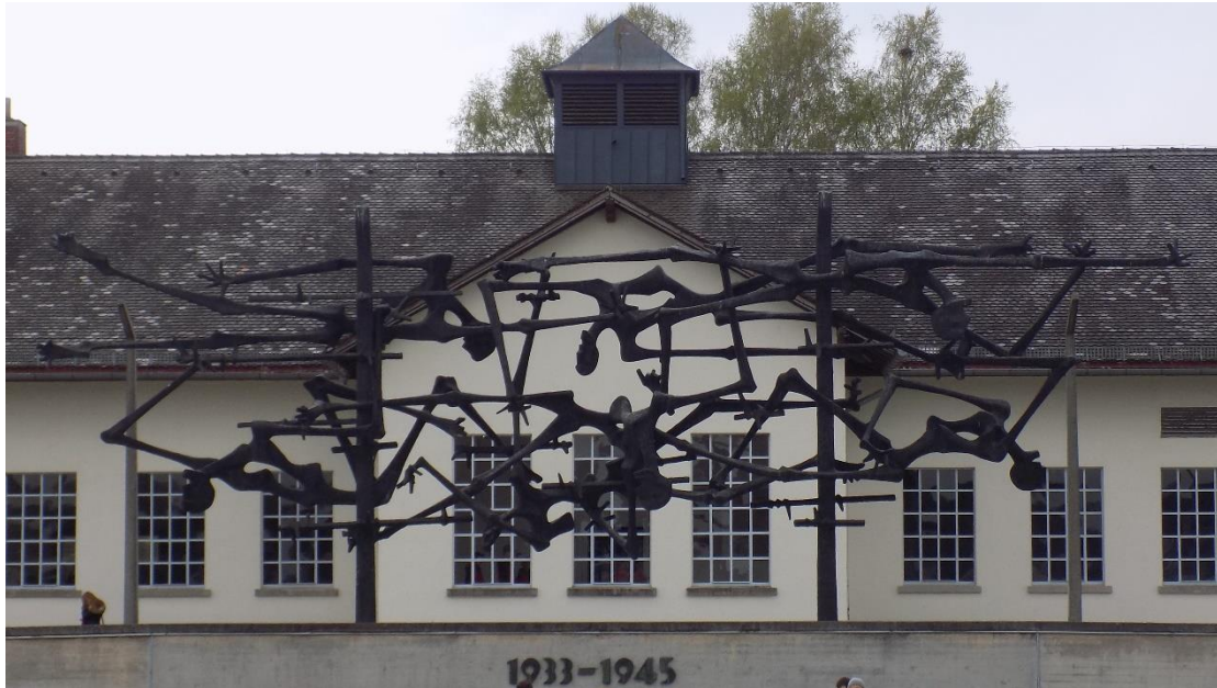
6. Άουσβιτς