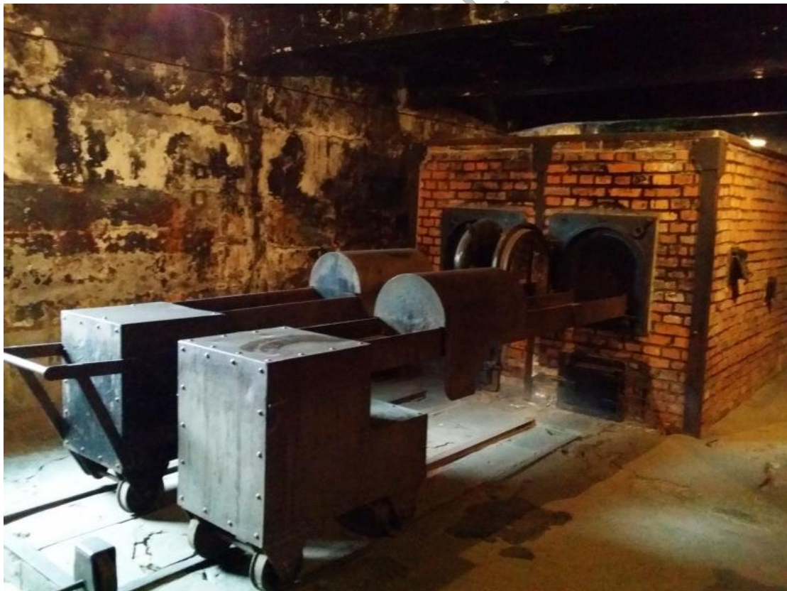
1. Το στρατόπεδο συγκέντρωσης του Άουσβιτς