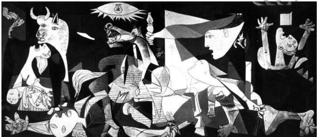
Pablo Picasso, Γκερνίκα, 1937. Εθνικό Μουσείο Τέχνης Βασίλισσα Σοφία, Μαδρίτη.

Η αποθέωση του πολέμου του Βασίλι Βερεστάγκιν