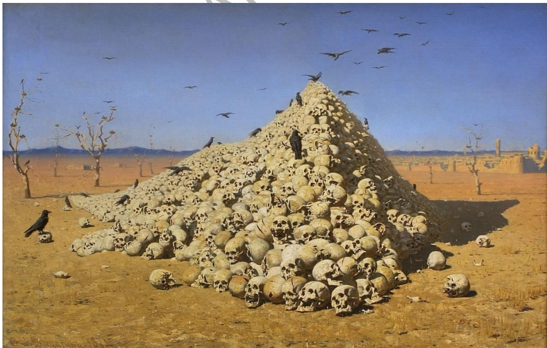
Vasily Vereshchagin, Η αποθέωση του πολέμου (1871). Πινακοθήκη Τσετσιακόφ, Μόσχα.