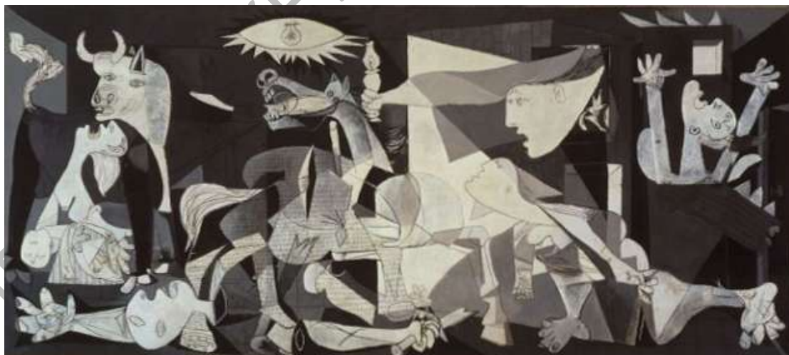
Γκερνίκα, Πάμπλο Πικάσο

Αφήγηση σε α' πρόσωπο, ομοδιηγητικός, αυτοβιογραφικός, δραματοποιημένος αφηγητής με εσωτερική εστίαση.