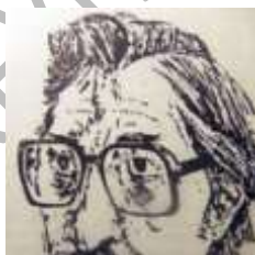
Ο Μανόλης Αναγνωστάκης κατά τον Χρόνη Μπότσογλου

Ανάμεσα στους ποιητές αυτής της περιόδου ξεχώρισε μια κατηγορία ιδεολόγων ποιητών που, μετά την ήττα της Αριστεράς το 1949, πίστεψαν ότι η γενιά τους πήγε χαμένη και πως προδόθηκαν από την ιστορία. Αποτέλεσμα αυτού του συναισθήματος είναι η απαισιοδοξία , η απόγοήτευση και η θλίψη που χαρακτηρίζει την ποίησή τους. Κύριος εκπρόσωπος της τάσης αυτής είναι ο ποιητής Μανόλης Αναγνωστάκης (1925-2005). Χαρακτηριστικό της ποίησής του η αποφθεγματικότητα , ο βαθύτατος μοραλισμός και ο διδακτισμός . Τα ποιήματα που γράφτηκαν τα πρώτα χρόνια της δικτατορίας και χαρακτηρίζονται από την ειρωνική τους γλώσσα .