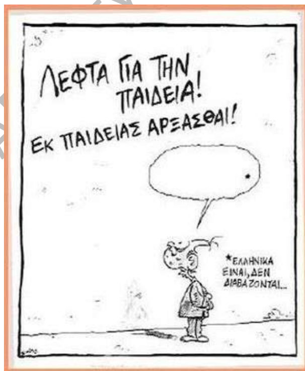
Σκίτσο Ν.ΓΛΩΣΣΑ Α' ΓΥΜΝΑΣΙΟΥ

στ) ..... οὐκ ἠδύναντο ἐλθεῖν εἰς ..... τὴν πόλιν.