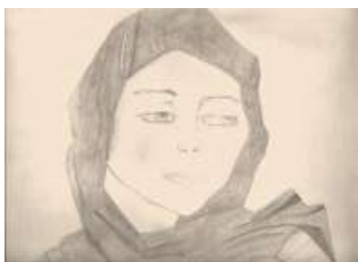
Σκίτσο Χριστιάνα Σεϊντή