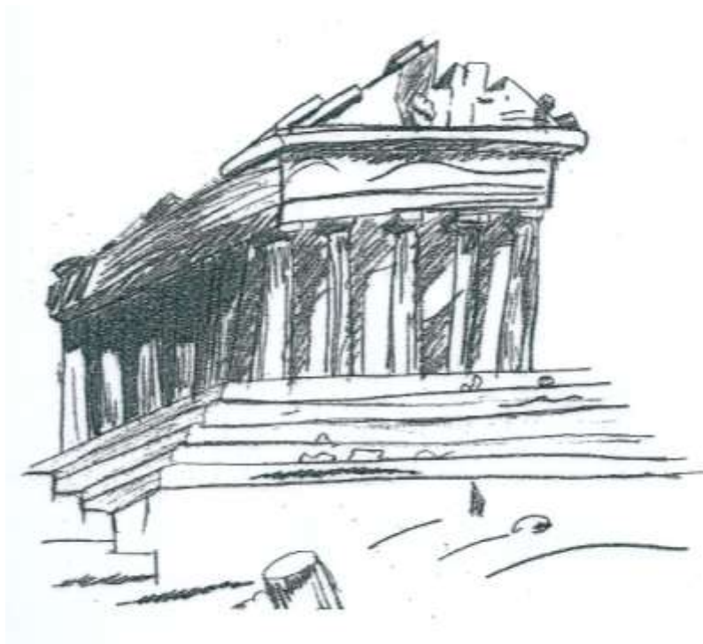
Σκίτσο Ηλίας Σαμαράς