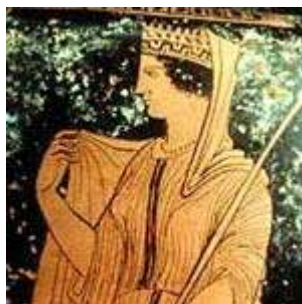
Σκηνή από το έθιμο των Εκδυσίων.

Ο μύθος αναφέρεται στη μεταμόρφωση του Λεύκιππου από κορίτσι σε αγόρι από τη θεά Λητώ. Η Γαλάτεια, η κόρη του Ευρυτίου του Σπάρτωνα παντρεύτηκε στη Φαιστό της Κρήτης με τον Λάμπρο τον γιο του Πανδίονα, άντρα ευγενικής καταγωγής, αλλά φτωχό. Αυτός, όταν έμεινε έγκυος η Γαλάτεια ευχήθηκε να αποκτήσει αγόρι, προειδοποίησε όμως τη γυναίκα του πως αν γεννήσει κορίτσι θα το σκοτώσει. Και η Γαλάτεια γέννησε κορίτσι. Και επειδή λυπήθηκε το βρέφος και σκέφτηκε τη μοναξιά στο σπίτι είπε ψέματα στον Λάμπρο λέγοντάς του ότι γέννησε αγόρι και το μεγάλωνε σαν γιο αφού το ονόμασε Λεύκιππο. Καθώς η κόρη μεγάλωνε και η ομορφιά της ήταν ανείπωτη, επειδή η Γαλάτεια φοβήθηκε τον Λάμπρο, πήγε στον ναό της Λητώς και ικέτευσε θερμά τη θεά μήπως με κάποιο τρόπο μπορούσε το κορίτσι να γίνει γι' αυτήν αγόρι. Και η Λητώ λυπήθηκε τη Γαλάτεια που συνεχώς θρηνούσε και την ικέτευε και άλλαξε τη φύση του κοριτσιού σε αγόρι. Αυτή την αλλαγή θυμούνται ακόμα οι Φαίστιοι (κάτοικοι της Φαιστού) και τη γιορτή την ονομάζουν Εκδύσια, επειδή το κορίτσι έβγαλε το πέπλο (απέβαλε τη γυναικεία φύση).