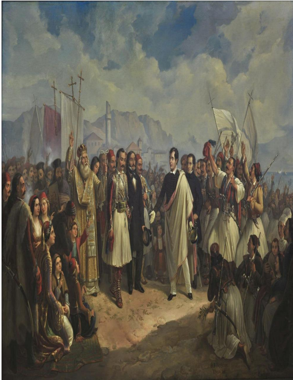
Θεόδωρος Βρυζάκης, Η υποδοχή του Λόρδου Βύρωνα στο Μεσολόγγι, 1861, λάδι σε μουσαμά, Εθνική Πινακοθήκη