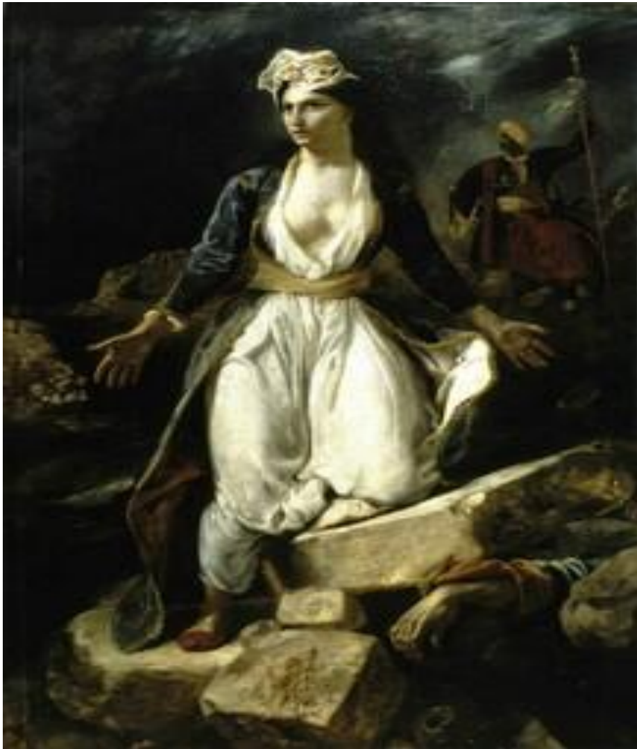
Ευγένιος Ντελακρουά: Η Ελλάς στα ερείπια του Μεσολογγίου

Αθανάσιος Διάκος: “Για δεσ καιρό που διάλεξε ο χάρος να με πάρει τώρα π’ ανθίζουν τα κλαδιά και βγάζ’ η γη χορτάρι”.