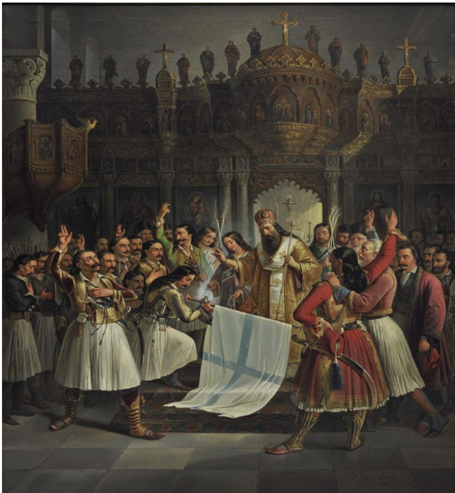
Θεόδωρος Βρυζάκης, Ο Παλαιών Πατρών Γερμανός ευλογεί τη σημαία της Επανάστασης, 1865, λάδι σε μουσαμά, Εθνική Πινακοθήκη

Ο Θεόδωρος Βρυζάκης εξέφρασε τη γενιά που διαμόρφωσε το νεοσύστατο ελληνικό κράτος. Στον πίνακά του «Ο Παλαιών Πατρών Γερμανός ευλογεί τη σημαία της Επανάστασης» οι μορφές με τις «ατσαλάκωτες» φορεσιές τους προσκυνούν τη σημαία μέσα σε πανηγυρικό και τελετουργικό κλίμα. Στο έργο αναδεικνύεται η ενότητα του λαού μπροστά στο εθνικό σύμβολο, κόντρα στους εμφύλιους σπαραγμούς.