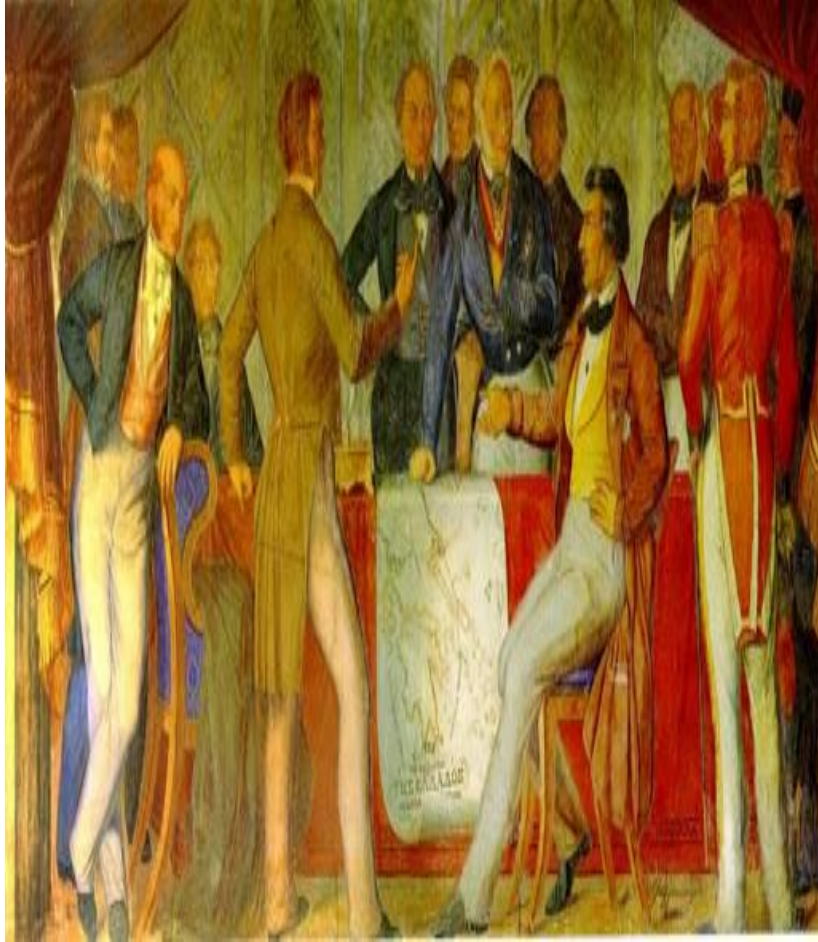
Η Συνθήκη του Λονδίνου. Αίθουσα των Τροπαίων, Βουλή των Ελλήνων