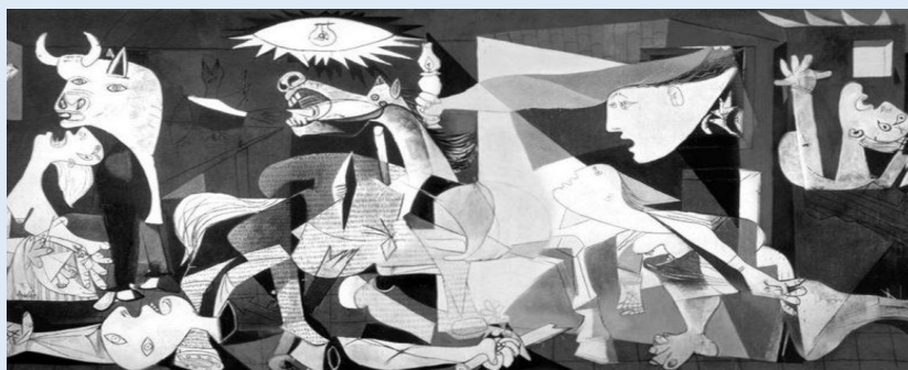
Pablo Picasso Guernica

50 για ένα πουκάμισο αδειανό, για μιαν Ελένη.