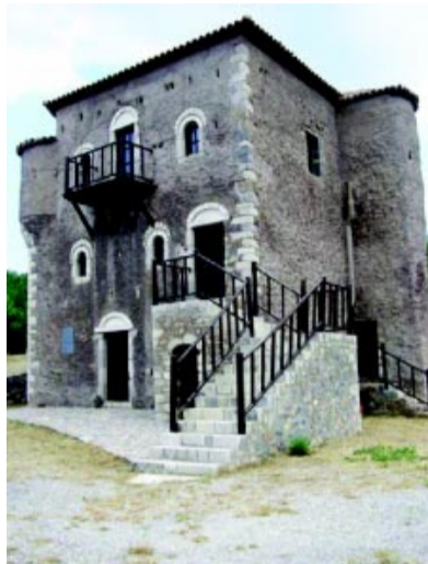
Ο πύργος του Πετμεζά στους Κάτω Λουσούς