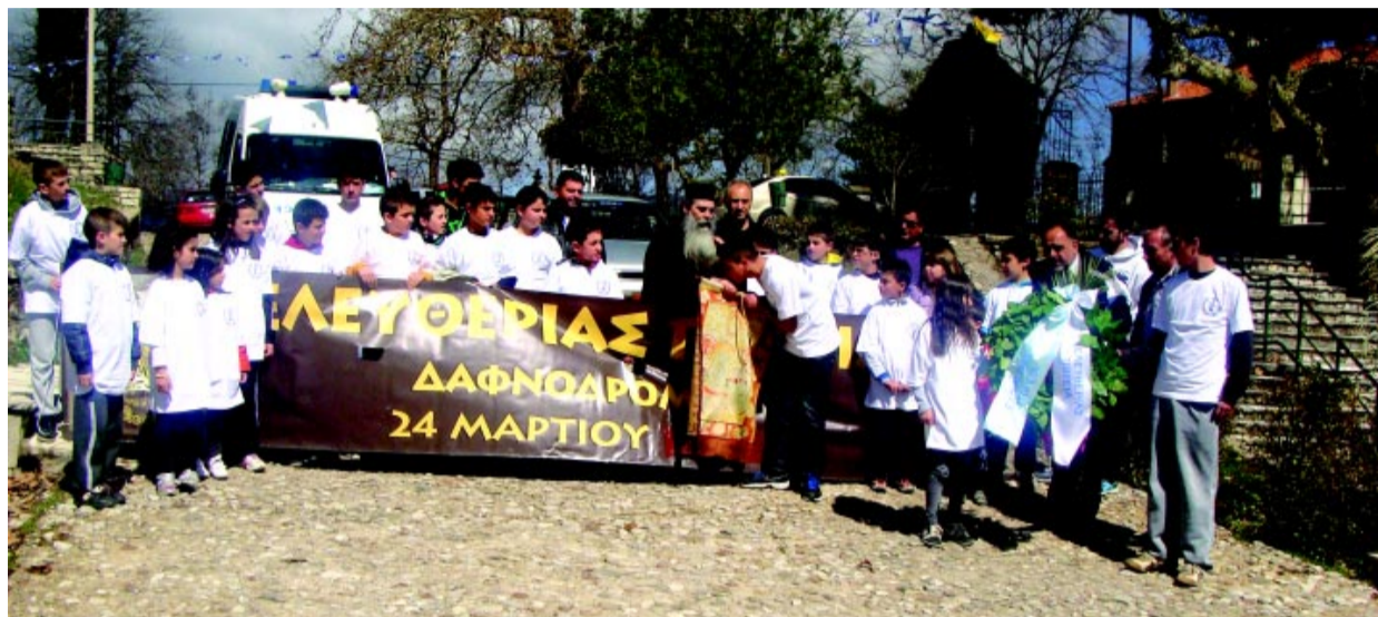
Η Ελευθερίας Πορεία από την Αγία Λαύρα στα Υψηλά Αλώνια της Πάτρας συνδιοργανώθηκε στις 22/3/2013 από τους Δήμους Καλαβρύτων, Ερμιάνθου και Πατρέων

Την επόμενη μέρα, το Γυμνάσιο Καλαβρύτων παρουσίασε τη σχολική γιορτή που προετοίμαζε εδώ και καιρό σε σχέση με τους ήρωες και την επανάσταση του 1821. Μαθητές