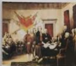
1776, Σενιαφιό, Η υπογραφή της ιστορικής Διακήρυξης της Ανεξαρτησίας, 4 Ιουλίου 1776.

Η Διακήρυξη της Ανεξαρτησίας Πρωτόκολλο με το οποίο ανεκηρύχθη η ανεξαρτησία των αποίκων από τη Βρετανική Αυτοκρατορία. Η Διακήρυξη της Ανεξαρτησίας, που ονομάζεται έτσι με βάση τον τόπο όπου έγινε, είναι ένα από τα πιο σημαντικά έγγραφα της ιστορίας των Ηνωμένων Πολιτειών. Ολοκληρώθηκε τον Αύγουστο του 1776, μετά από έναν μήνα διαπραγματεύσεων, στην πόλη Φιλαδέλφεια. Η Διακήρυξη αποτελείται από τρεις μέρη: το πρώτο, που ξεκινάει με τον περίφημο λόγο «Όταν οι άνθρωποι δημιουργούνται, είναι ελεύθεροι και ίσοι στην αξιοπρέπεια και τα δικαιώματα», και περιγράφει τα δικαιώματα που πρέπει να έχουν οι άνθρωποι, όπως η ζωή, η ελευθερία και η ασφάλεια. Το δεύτερο μέρος της Διακήρυξης περιγράφει τις αιτίες της ανεξαρτησίας, και το τρίτο μέρος περιγράφει τις αρχές της νέας κυβέρνησης.