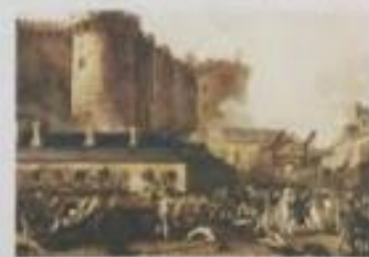
Η 14η Ιουλίου είναι ο πιο σημαντικός ημερομηνία της Γαλλίας.