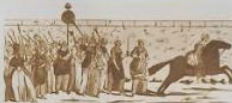
Η Τρίτη τάξη και η Βουστία.

▲ Όταν ο βασιλιάς την Βουστία των τριών τάξεων έφτασε στο βασιλικό όραμα ήταν οι φτωχοί. Δεν ήθελαν να πληρώ με φόρους και να μην έχουν καμία ελπίδα. Έτσι, μια ομάδα φτωχών από τη Βουστία έφτασε στην Βουστία. Αυτοί οι φτωχοί ήταν οι πρώτοι που υποστήριξαν ότι η 3 η τάξη και οι αριστοί αποτελούσαν εθνική συνέλευση. Αυτοί οι φτωχοί ήταν οι πρώτοι που υποστήριξαν ότι η 3 η τάξη και οι αριστοί αποτελούσαν εθνική συνέλευση.