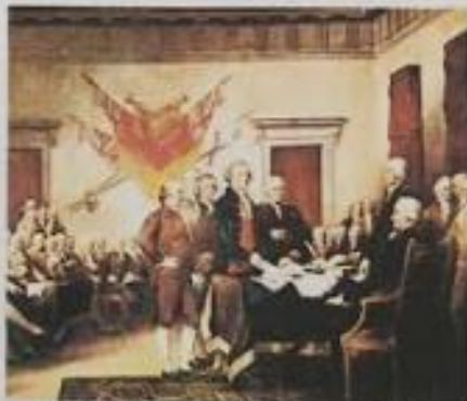
► Τζ. Τζέφρεϊ, Η υπογραφή της αμερικανικής Διακήρυξης της Ανεξαρτησίας, 4 Ιουλίου 1776. Η 4η Ιουλίου αποτελεί εθνική γιορτή των ΗΠΑ.

► Το άγαλμα της Ελευθερίας στο λιμάνι της Νέας Υόρκης, το οποίο γράφεται και είναι γράφεται το εθνικό γράμμα από τη Διακήρυξη της Ανεξαρτησίας . Η Ελευθερία που αναπαριστάται τη θρησκεία της Ελευθερίας στο λιμάνι των αθηνών. Το άγαλμα είναι δώρο των Γάλλων και απεικονίζει τη φωνή του αιώνα στις δύο γλώσσες. Η Ελευθερία βασίζεται στο ένα γράμμα δόξα και στο άλλο τη Διακήρυξη της Ανεξαρτησίας .