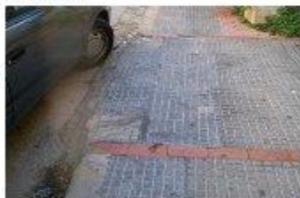
Στην οδό Καρόμματα η ράμπα έχει κλείσει από αυτοκίνητο

Το φαινόμενο αυτό παρατηρείται έντονα και στον δήμο του Αγίου Δημητρίου. Ο Άγιος Δημητρίος αποτελεί νότιο προάστια της Αθήνας, στην Ελλάδα και ο πληθυσμός του υπολογίζεται γύρω στις 65.173 κατοίκους. Ο Άγιος Δημητρίος παρουσιάζει ελλειψη ραμπών καθώς σε πολλές δημόσιες κτίρια του δήμου δεν υπάρχει στην είσοδο το ειδικά διαμορφωμένο καλεσμένο επίπεδο που διασφαλίζει την πρόσβαση των αναπηρών. Όμως, ακόμα και στα σημεία όπου το κράτος έχει φροντίσει να υπάρχουν ράμπες η πρόσβαση των αναπηρών εμποδίζεται από τα οχήματα, τα οποία είναι σταθμευμένα εκεί.