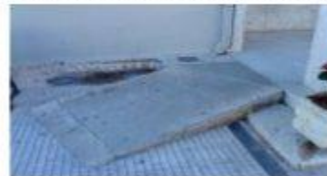
Στην είσοδο του δημαρχείου υπάρχει ειδική ράμπα