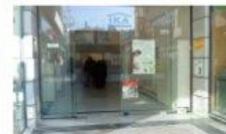
Στην είσοδο του Ι.Κ.Α. δεν υπάρχει κανένα ειδικό δάπεδο που εμποδίζει η πρόσβαση των ανθρώπων με κινητικά προβλήματα...

Γι αυτό το λόγο πραγματοποιήσαμε μια έρευνα στα σχολεία του δήμου μας για να διαπιστώσουμε εάν υπάρχουν οι κατάλληλες προδιαθέσεις, για να μπορούν να φτάσουν εύκολα τα παιδιά με κινητικά προβλήματα τα