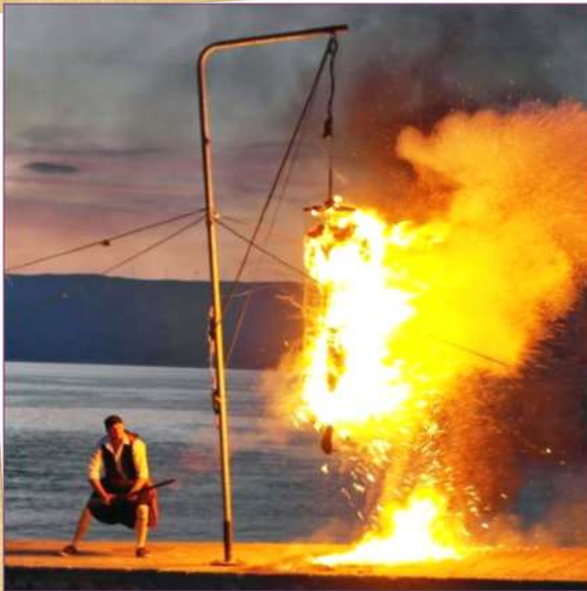
Το κάψιμο του Ιούδα!

Ξεχωριστό έθιμο της Λαμπρής αποτελεί «Το κάψιμο του Ιούδα», το οποίο το συναντούμε σε διάφορες παραλλαγές του σε πολλές περιοχές της Ελλάδας.