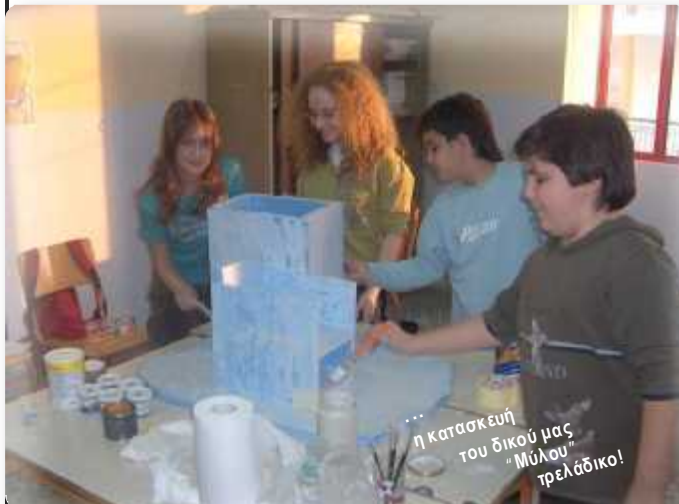
... η κατασκευή του δικού μας "Μύλου" τρελάδικο!

Για την κατασκευή του νερόμυλου χρησιμοποιήσαμε ... Φελιζόλ το οποίο κόψαμε σε