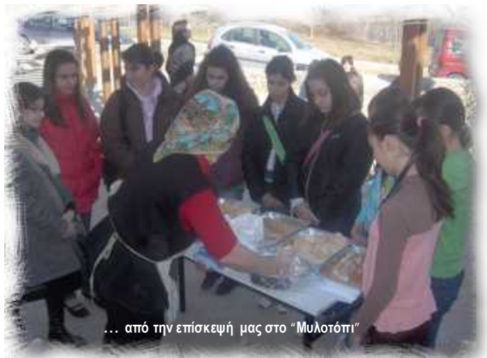
... από την επίσκεψή μας στο "Μυλοτόπι"

Οι τρεις νερόμυλοι βρίσκονται στον δήμο Πολίχνης και πιο συγκεκριμένα πάνω από την περιφερειακή οδό της Θεσ/νίκης. Σε αρχαιολογικό πάρκο μετέτρεψε ο Δήμος Πολίχνης το μέρος που λέγεται "Μυλοτόπι". Όλοι οι κάτοικοι της Θεσσαλονίκης μπορούν να επισκε-