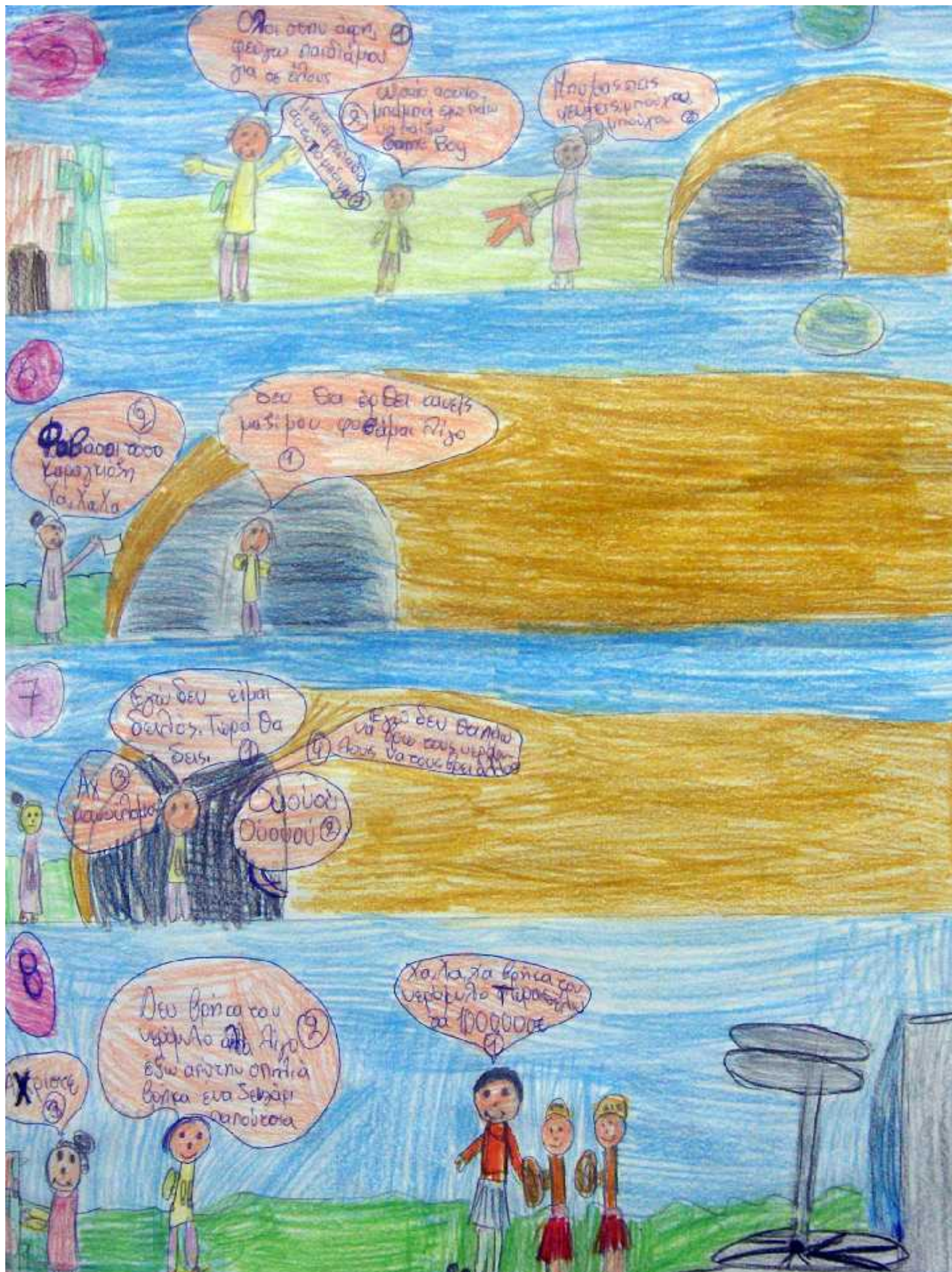
Δήμητρα Σάββα - Δήμητρα Αμπεριάδου - Χαρούλα Καβαριδίου - Σάββας Αλεξανδρίδης