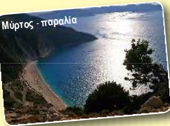
Μύρτος - παραλία

Η Κεφαλονιά είναι το μεγαλύτερο νησί από τα Επτάνησα και βρίσκεται νότια από τη Λευκάδα και την Ιθάκη και βόρεια από τη Ζάκυνθο. Είναι νησί ορεινό με σημαντικότερο βουνό τον Αίνο που έχει ύψος 1626 μέτρα και είναι σκεπασμένος από μια μοναδική ποικιλία ελάτου. Έχει λιγοστές πεδιάδες και πολλούς κόλπους και ακρωτήρια.