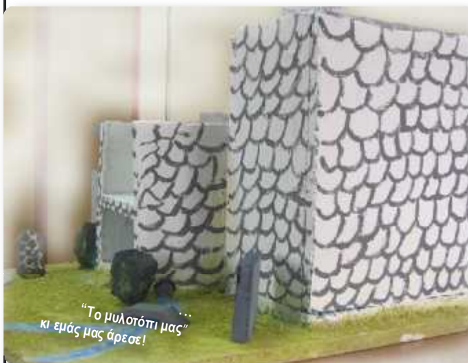
"Το μυλοτόπι μας" κι εμάς μας άρεσε!

κομμάτια αφθαγόμια και αφθαγόμια με τις σπασίες κάναμε τις συνδέσεις των φελιζόλ. Πέρασαμε με γύψο όλη σχεδόν την επιφάνεια του φελιζόλ και στη συνέχεια τη βά-