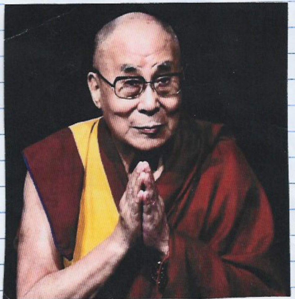
Στη φωτογραφία ο 14ος Δαλάι Λάμα.

Εκπρόσωπος του Θιβετιανού Βουδισμού είναι ο Δαλάι Λάμα που σημαίνει «δάσκαλος».