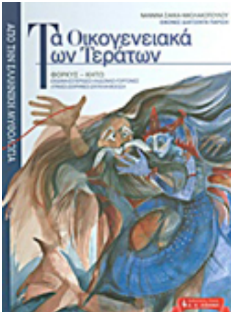
Ελλάδα: Πρώτο βιβλίο γνώσεων για παιδιά «Τα Οικογενειακά των Τεράτων» (Κώστας Τσουκάλης) του Κώστα Τσουκάλη και το «Αλλόκοτο μητέρερα» (Λιβάνης)