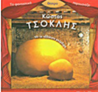
Ελλάδα: Βιβλίο γνώσεων για παιδιά «Τα Οικογενειακά των Τεράτων» (Κώστας Τσουκάλης) του Κώστα Τσουκάλη και το «Αλλόκοτο μητέρερα» (Λιβάνης)