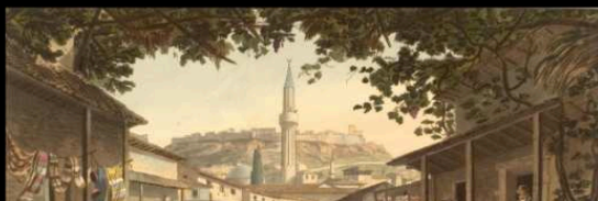
Η αγορά της Αθήνας κατά την οθωμανική κυριαρχία